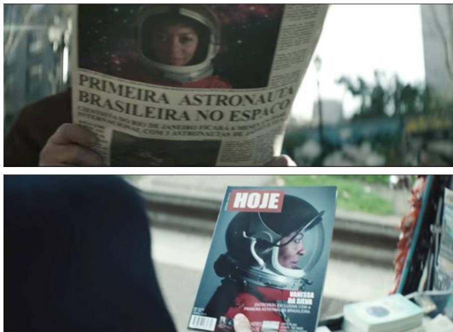
Figura 3 - A reconhecimento profissional da Astronauta