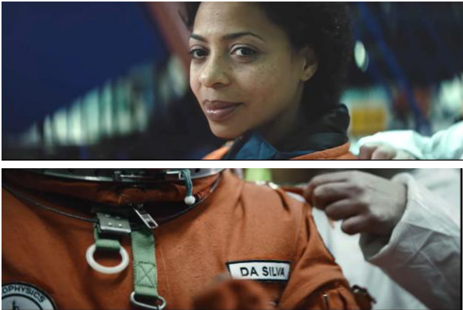
Figura 4 - Astronauta no trabalho

Esse estágio inicia-se com a astronauta em uma base espacial, preparando-se para trabalhar.