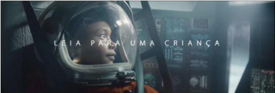
Figuras 9 - Astronauta criança e astronauta adulta