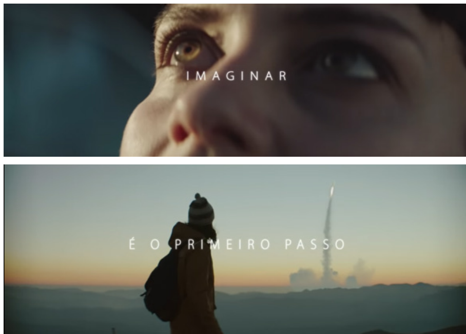
Figuras 8 - Crianças olhando para o espaço

Nesse ponto do enredo são mostradas várias crianças que veem o foguete no céu e param para apreciá-lo.