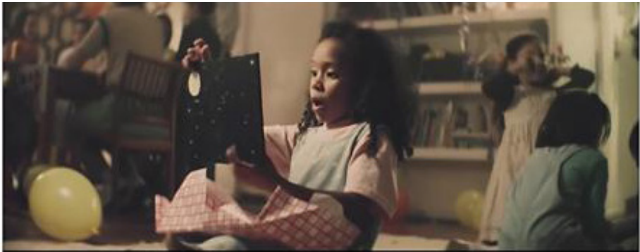
Figura 2 - O livro infantil como presente

Em suas lembranças, a astronauta se recorda de quando ganhou o livro em sua infância e do quão feliz ficou ao recebê-lo. O título da obra é "A menina das estrelas", cuja capa contém um desenho de um foguete branco e verde ao longo de estrutura e vermelho na ponta, bem como de um desenho de uma lua branca com bolas vermelhas em seu interior. Vale ressaltar que o filme deu origem a um livro digital da Coleção Kidsbook Itaú Criança. Com ilustração do francês Laurent Cardon, o livro é a versão da cantora e compositora Tulipa Ruiz 3 .