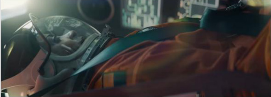
Figura 6 - O preparo para a decolagem para o espaço sidera

A próxima cena já mostra a astronauta vestida com sua roupa espacial e capacete. Ela já está na aeronave, preparando-se para a decolagem.