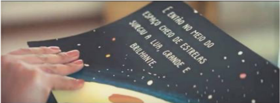
Figura 1 - O livro "A menina das estrelas"