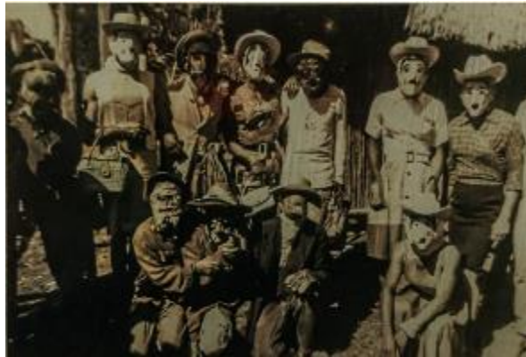
Figura 3. Danza de Huehues 1950-1960