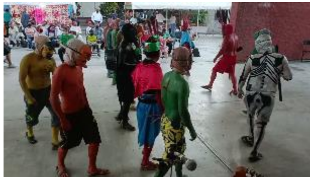
Figura 2. Recreación de la antigua representación de la danza