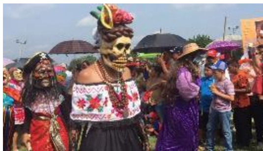
Figura 4. Actual representación