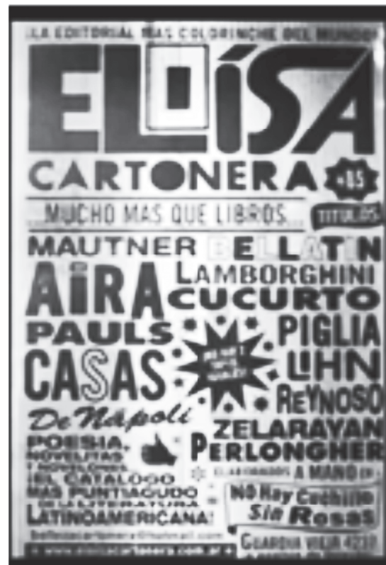
Foto 1. Eloisa Cartonera.

Con el éxito de esta propuesta se creó la “Editorial Eloisa Cartonera” que luego incorporó la producción de libros reciclados con decoración individual de literatura original de los autores Argentinos Ricardo Piglia y César Aira, luego la Mexicana Margot Glanz y la Chilena Diamela Eltit, con el fin de contribuir con la subsistencia de los participantes del programa. (Ruíz, 2009). (Ver foto 1).