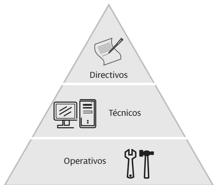
Figura 4. Escala Laboral

La acción del creador de empresa debe contar con un adecuado "clima para emprender", es decir, un marco de referencia donde emprendedores, empresas, instituciones educativas y estado, sean parte de un sistema, donde todos interactúen integrados entre sí y resulten mutuamente dependientes y beneficiados. (Martín C.)