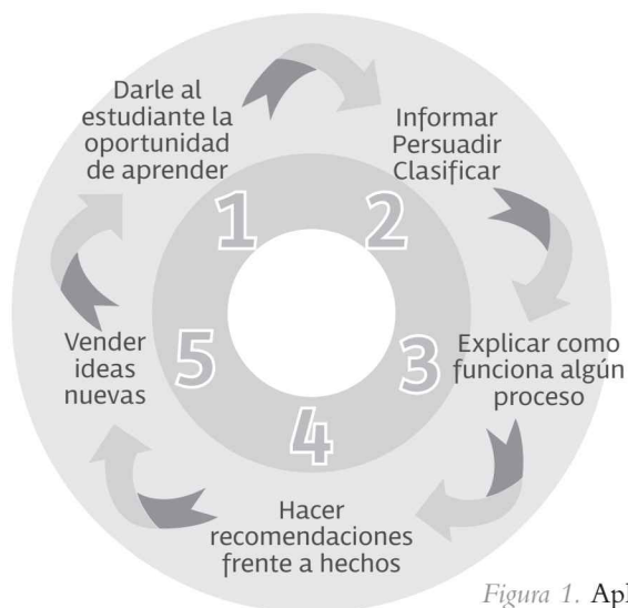
Figura 1. Aplicaciones de Competencias Laborales