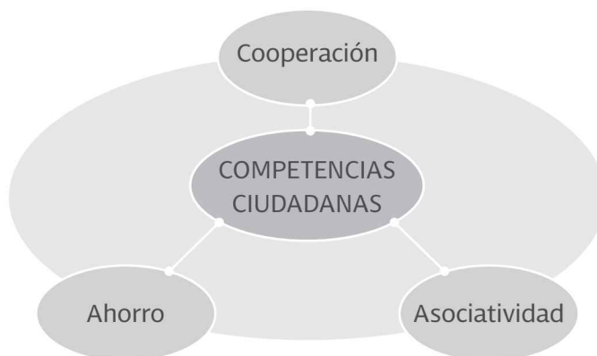
Figura 2. Fomento de las competencias ciudadanas

Es el trabajo en común llevado a cabo por parte de un grupo de personas o entidades mayores hacia un objetivo compartido, generalmente usando métodos también comunes, en lugar de trabajar de forma separada en competición.