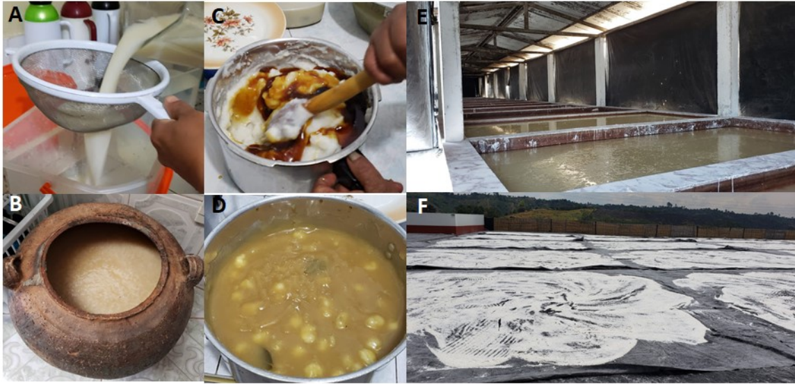
Figura 1. Productos fermentados artesanalmente. A y B filtración y fermentación de Masato de arroz. C y D. mezcla de almíbar y Champús y E y F. fermentación y secado de AYA.