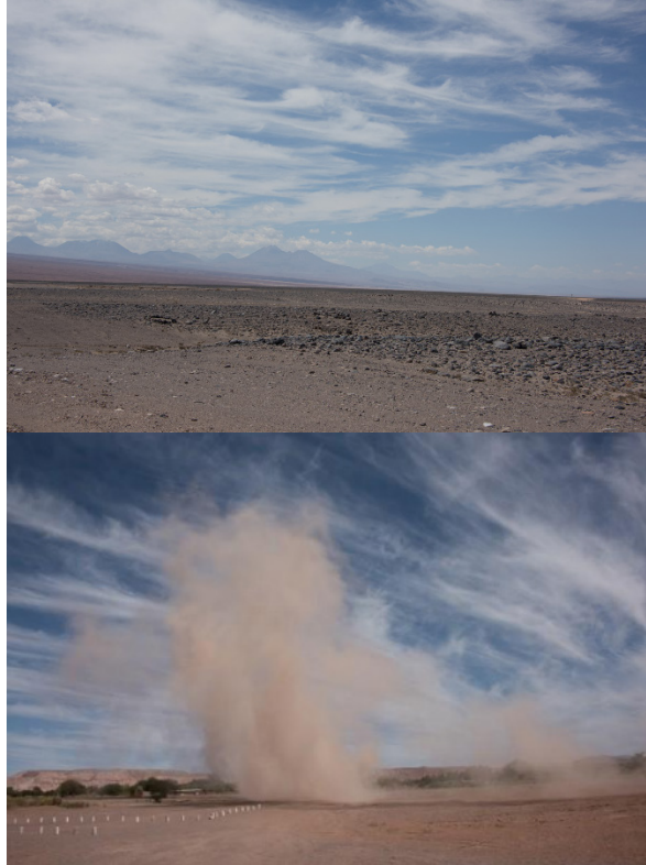
Figuras 1 y 2. Campos Minados. Desierto de Atacama, Chile Figures 1 and 2. Minefields. Atacama Desert, Chile