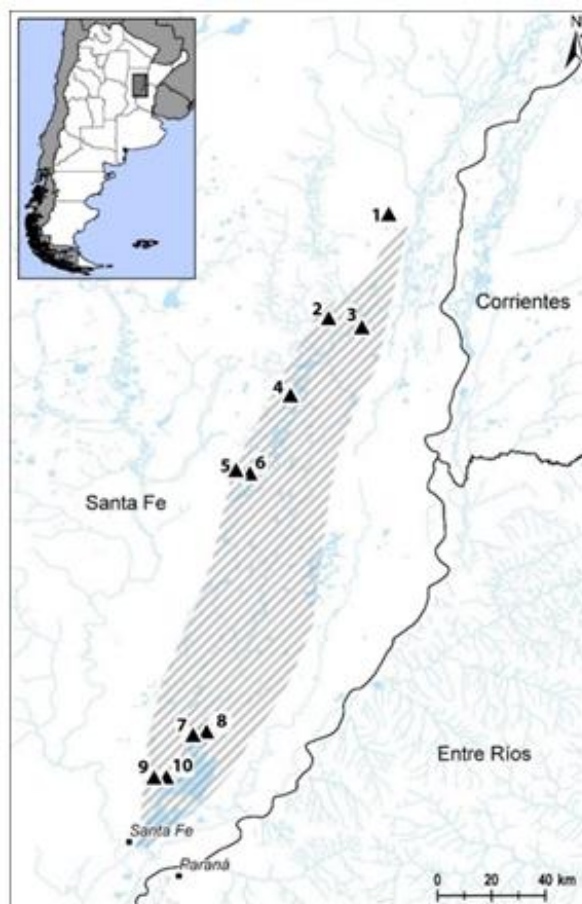
Figura 1. Área correspondiente al Bajo de los Saladillos y sitios arqueológicos mencionados son: 1- Kees; 2- Los Hornitos; 3- La Lechuza; 4- Laguna del Plata II; 5-Coria; 6-Salteño; 7-Isla Barranquita I; 8- Isla Barranquita II; 9- El Capón I; 10- Isla Cementerio.

Este sitio arqueológico, aún inédito, se encuentra en la margen izquierda del arroyo Saladillo, coordenadas geográficas (31°15'20.42" Lat. S - 60°27'20.38" Long. O) (Figura 1), a unos 70 m al SE del sitio Isla Barranquita I (Cornero y Cocco 1995). El sitio está representado por un entierro primario que fue recuperado semiexpuesto en la superficie de la Formación Tezanos Pinto, sobre una plataforma de erosión del Saladillo, a pesar de haber logrado recolectar material arqueológico, constituidos por fragmentos de cerámica lisos, no se ha podido establecer asociación con el entierro.