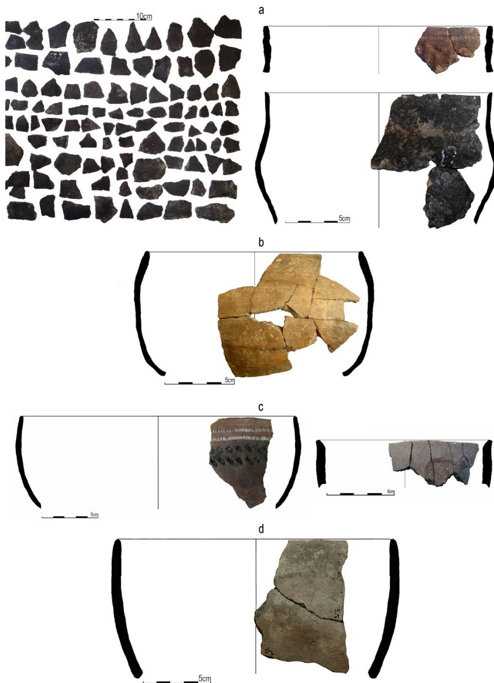
Figura 1. Contornos de vasijas recurrentes en el centro-este de Argentina. Referencias: a= conjunto de tiestos y piezas incluidas en el NMV de Los Tres Cerros 1, delta superior del río Paraná; b= cuenco procedente de Los Tres Cerros 1, delta superior del río Paraná; c= posibles cuencos procedentes de Calera (sector noroccidental del sistema serrano de Tandilia); d= posible cuenco procedente de Loma de los Muertos, valle medio del río Negro.