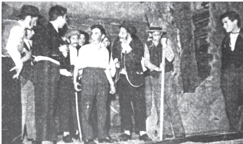
Obra: Los Aparecidos — Galería Salesiana.

variedades (comedia, juguete, sainete, farsa, etc.) como "El chico de la tienda" "Los caciques", "La charanga", hasta completar un largo etc. que sitúa al Centro Mariano entre los Cuadros Artísticos más activos del momento dentro del panorama de la escena pamplonesa, siendo todo un referente para el aficionado en el terreno amateur. A mediados de la década de los años cincuenta cesa en su actividad teatral.