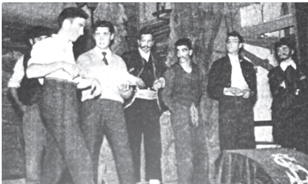
Obra: Los aparecidos - Galería Salesiana.

A partir de la década de los cincuenta, la llegada de la televisión y la consolidación del cine, entre otros motivos, propició la desaparición de estos grupos teatrales. Los últimos en desaparecer fueron los del Servicio Doméstico y el de los Salesianos -a principios de los sesenta- acabando así, toda actividad escénica en el terreno amateur. Actividad que marcó toda una época.