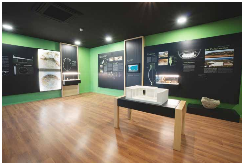
Lámina 1. Vista de la sección dedicada a Roma en la planta 1 del Museo de Nerja

estar relacionada con la producción del garum , aunque, como ocurre en otras villas, no debemos descartar un aprovechamiento intensivo de las extensas tierras que hay en todo su entorno. El hecho de que aparezcan restos de cenizas y algunas piezas con defecto de cocción, nos indica que también debió existir un complejo alfarero vinculado a la actividad productiva del asentamiento.