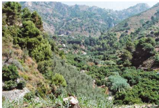
Lámina 11. Panorámica desde el sur del yacimiento de Casa Fuerte.

Debido a su ubicación debemos descartar de que este yacimiento esté asociado a una villa , sin embargo, teniendo en cuenta que la antigua vía romana transcurría por aquí, ya que era el paso natural hacia la vega granadina, interpretamos que este edificio pudo ser una statio o una mansio (lám. 11).