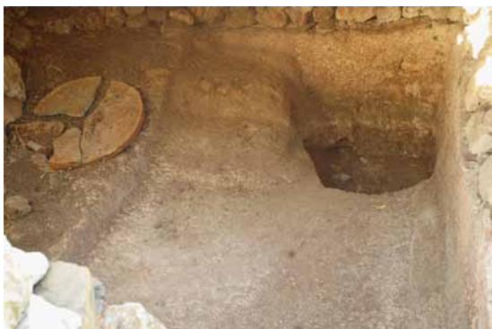
Lámina 7. Pileta en el yacimiento de El Lugarejo