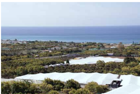
Lámina 2. Panorámica desde el norte del yacimiento de Los Cancharrales

estar relacionada con la producción del garum , aunque, como ocurre en otras villas, no debemos descartar un aprovechamiento intensivo de las extensas tierras que hay en todo su entorno. El hecho de que aparezcan restos de cenizas y algunas piezas con defecto de cocción, nos indica que también debió existir un complejo alfarero vinculado a la actividad productiva del asentamiento.