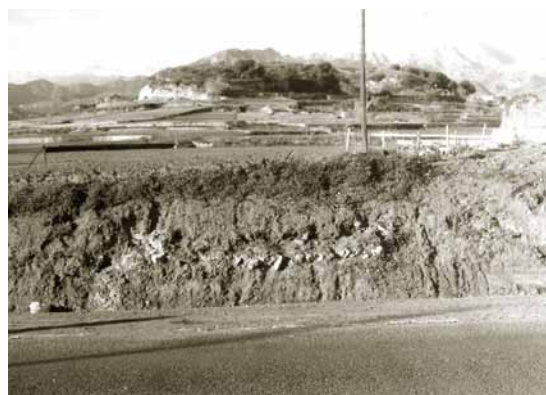
Lámina 3. Pileta cortada por la ampliación de la N-340. Los Cancharrales. Fotografía de Pedro Rodríguez Oliva, 1976

En la actualidad y en el entorno de la antigua fábrica azucarera San Joaquín (fig. 3), se conserva un tramo de calzada de 35 m de longitud y 5,40 m de ancho. Formaba parte de la vía que unía Cástulo con Malaca y de la que existe