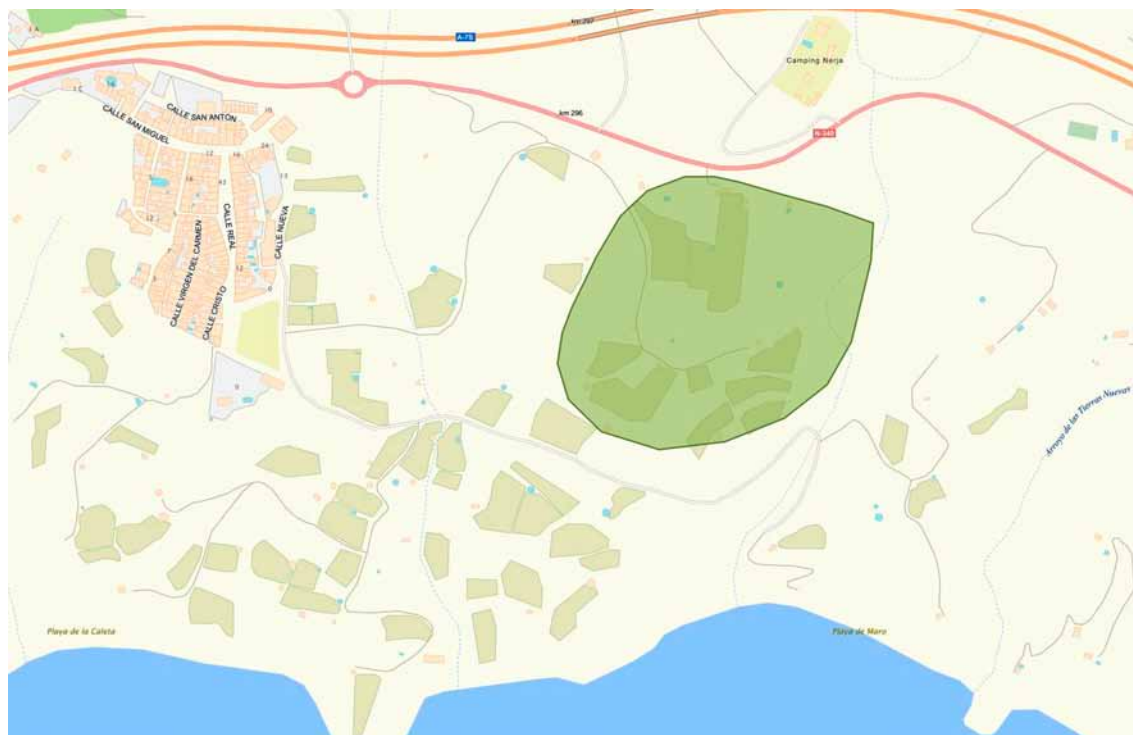
Figura 4. Extensión estimada del yacimiento de El Lugarejo