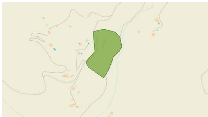
Figura 5. Extensión estimada del yacimiento de Casa Fuerte

La pileta tiene forma rectangular con unas dimensiones aproximadas de 1,5 x 3 m, y un alzado conservado de 0,5 m. Está construida con mampostería y revestida por una densa capa de opus signinum . Conserva parte de sus medias cañas en las esquinas y en los bordes del fondo, así como un pocillo en una esquina para su limpieza. La pileta ha sido recrecida