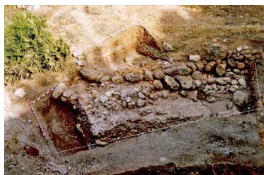
Lámina 6. Machos del puente del arroyo de La Coladilla durante su excavación en 1998.

Está situado al este de Maro, en una serie de huertas abancaladas al sur del camping de Maro (fig. 4). En él se conserva una de las piletas que se utilizaban para la elaboración del garum , que hasta hace muy poco era usada para almacenar herramientas. En los bancales para el aterrazamiento de las huertas podemos observar cómo se han reutilizado un buen número de fragmentos de obras y cerámicos.