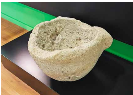
Lámina 4. Mortero de piedra fosilífera encontrado en las huertas existentes en el yacimiento de Los Cancharrales