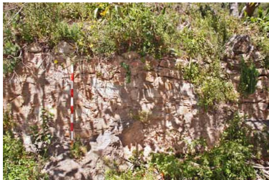
Lámina 10. Muro emergente en el yacimiento de Casa Fuerte