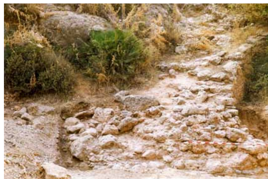
Lámina 5. Calzada romana de La Coladilla durante su excavación en 1998.

constancia en el Itinerario de Antonino. Esta misma vía se siguió utilizando desde entonces y hasta finales del siglo XIX, formando parte del camino de Vélez-Málaga a Almuñécar a su paso por Nerja.