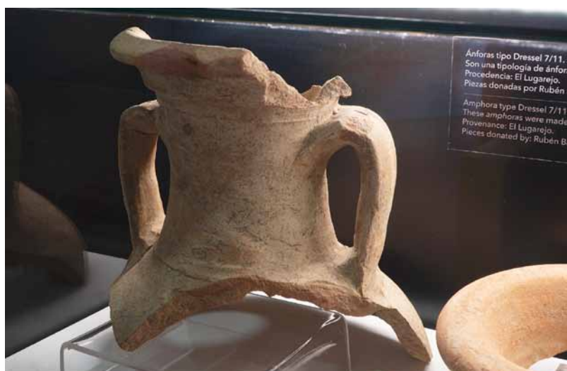
Lámina 9. Ánfora Dressel 7-11 expuesta en el Museo de Nerja procedente de El Lugarejo

En la actualidad se pueden ver algunos muros con alzados de un metro de altura, aunque es complicado determinar si forman parte del yacimiento romano (lám. 10).