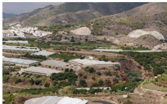
Lámina 8. Panorámica desde el este del yacimiento de El Lugarejo

halladas en el lugar, concretamente la Dressel 7-11, expuestas actualmente en el Museo de Nerja (lám. 9), no habría que descartar, de igual forma, una actividad vinculada a la pesca y a las salazones.