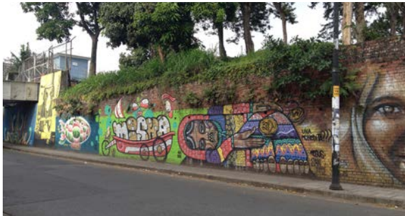
Figura 1 Grafiti en San José.