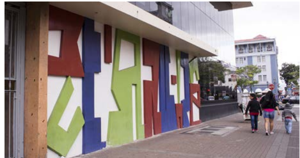
Figura 3 Manuel de la Cruz González. Mural espacial . Edificio de Tributación Directa, San José.