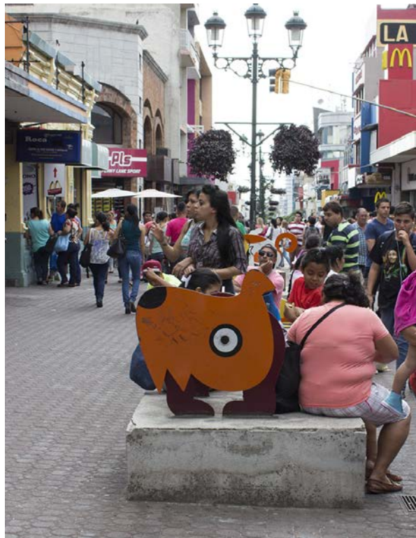
Figura 2 Francisco Munguía. Homenaje al zaguete . Avenida Central, San José.