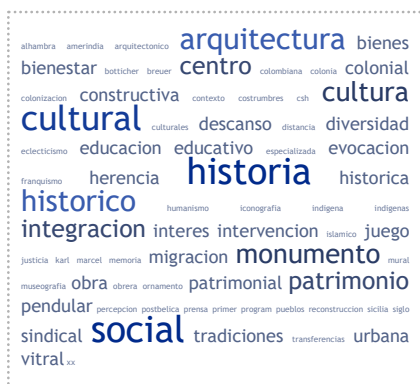
Figura 6. Nube de palabras correspondiente a las revistas de arquitectura bajo el grupo temático Urbanismo y Paisaje