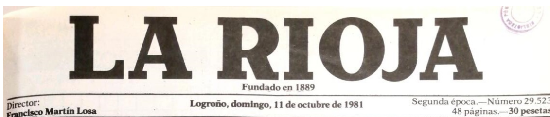
Imagen. Cabecera de la portada de La Rioja del 11 de octubre de 1981.