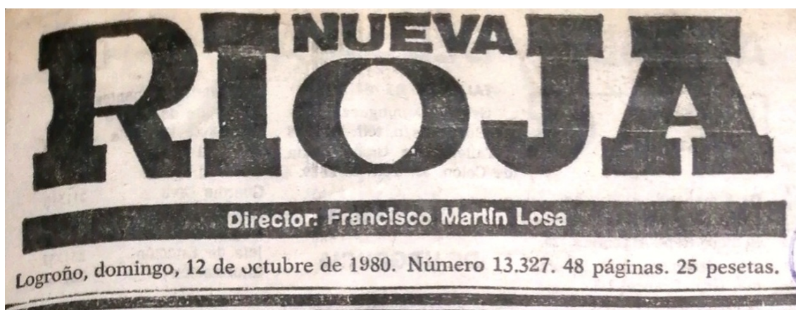
Imagen. Cabecera de la portada de Nueva Rioja del 12 de octubre de 1980.

A lo largo de los cuarenta años del régimen franquista, el periódico se adaptará a los planteamientos dominantes del mismo, para lo cual plantea cuestiones sobre la ideología o sobre el modelo de sociedad que debe generalizarse. En este abanico, la cuestión femenina no va a ser menos importante, a pesar de no dejarlas participar directamente en la sociedad, sino que se va a reconducir su espacio en ciertas vertientes permitidas, sin que trasciendan de ellas.