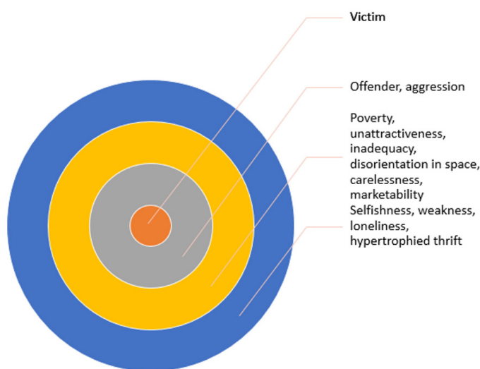
Figura 2. Signos de la imagen mediática de las personas mayores en los contenidos de los medios de comunicación ucranianos

la falta de atractivo, la inadecuación, la desorientación en el espacio, el descuido, la comerciabilidad; la periferia lejana - el egoísmo, la debilidad, la soledad, el ahorro hipertrofiado (Figura 2). Por supuesto, no hay una línea clara entre estos rasgos, algunos materiales pueden incluir dos o más rasgos al mismo tiempo. Sólo una revisión superficial muestra que los medios de comunicación, bajo la presión de ciertos factores externos, especialmente el gusto de la audiencia, los imperativos del mercado y el sensacionalismo, ofrecen a la audiencia juicios indiferenciados y sesgados sobre la generación mayor, presentando una imagen distorsionada del mundo, creando una construcción artificial.