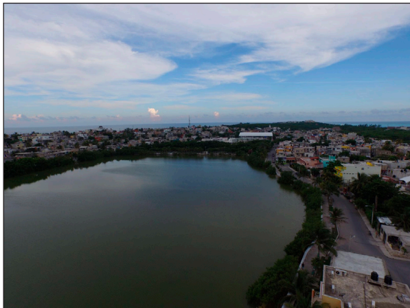
Figura 1. Salina Grande