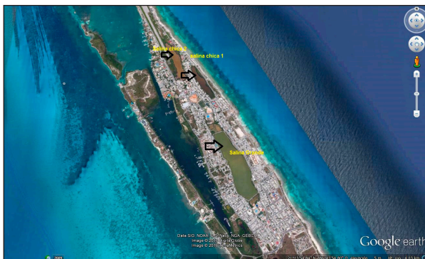
Figura 2. Ubicación Salina Grande