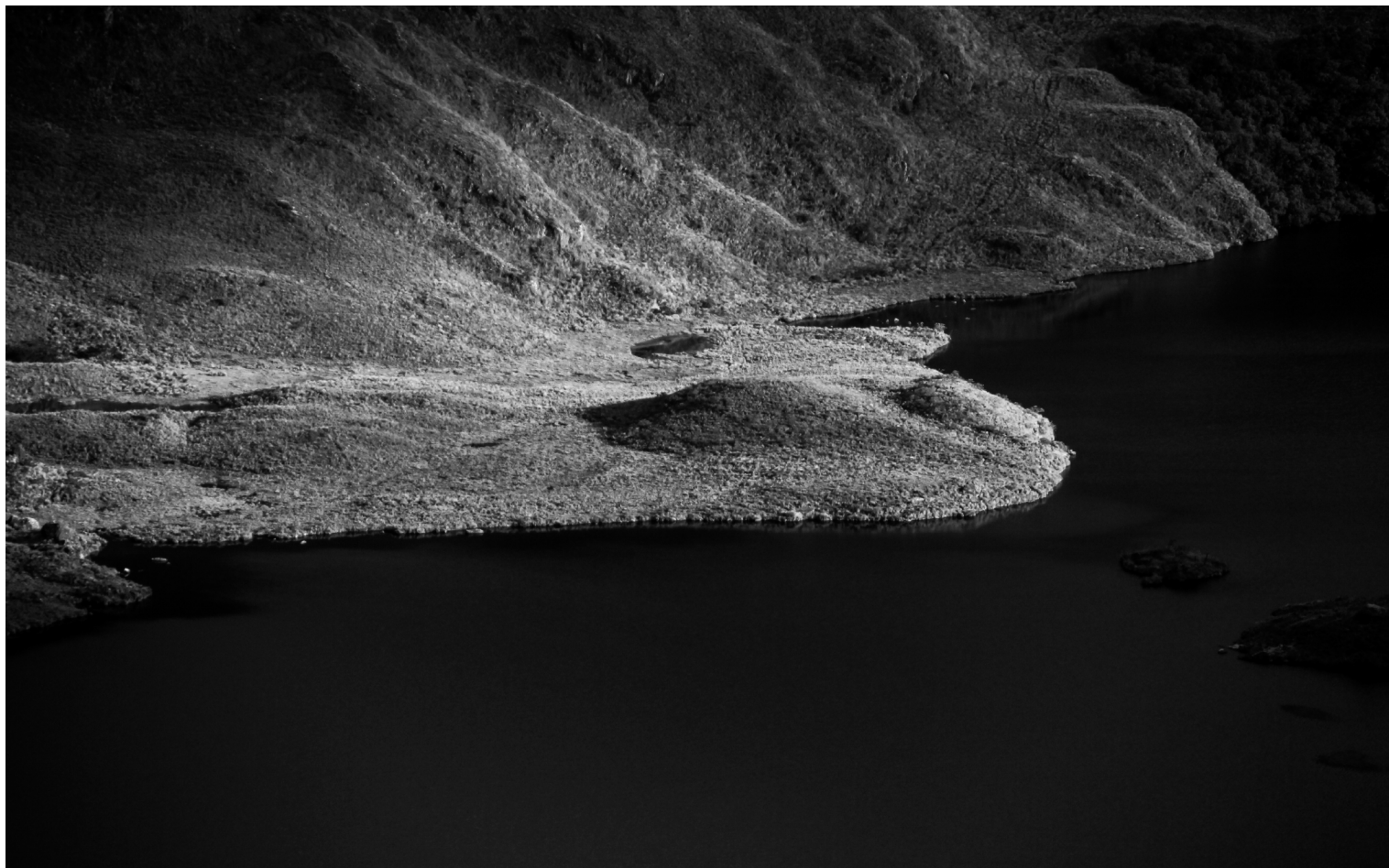
Parque Nacional Cajas, Ecuador (2015)