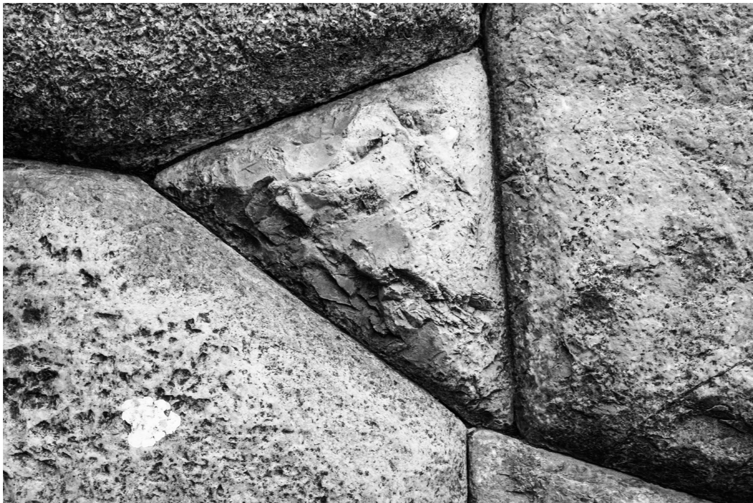
La distancia que dibuja las esquinas Cusco, Perú (2010)