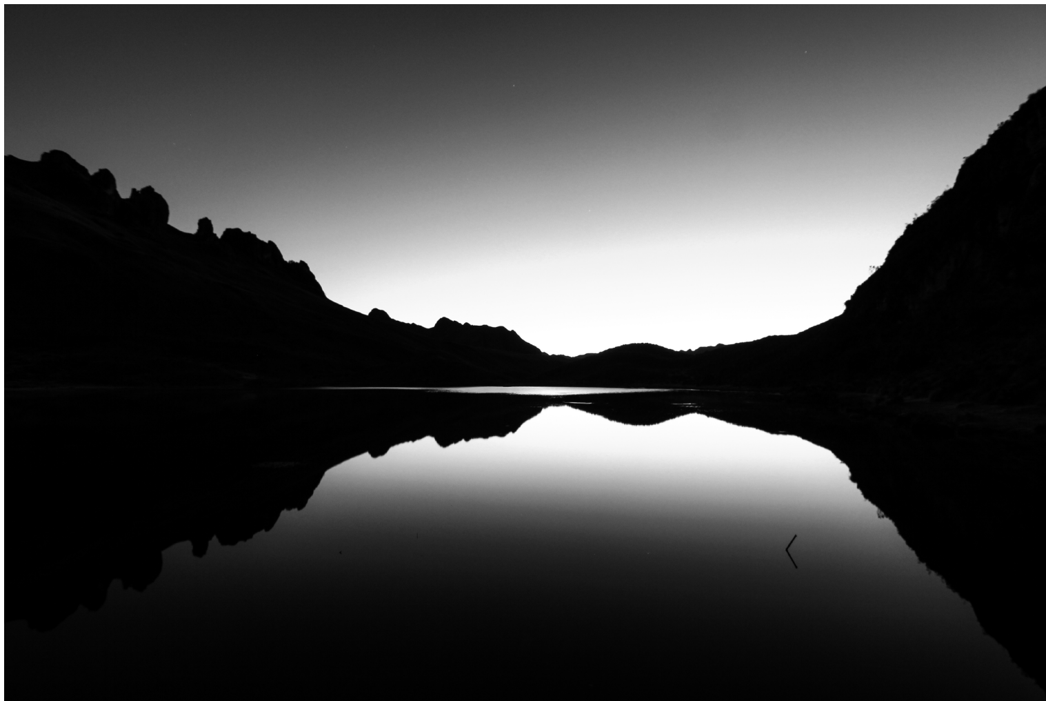
Lo gris cuando camina Parque Nacional Cajas, Ecuador (2016)