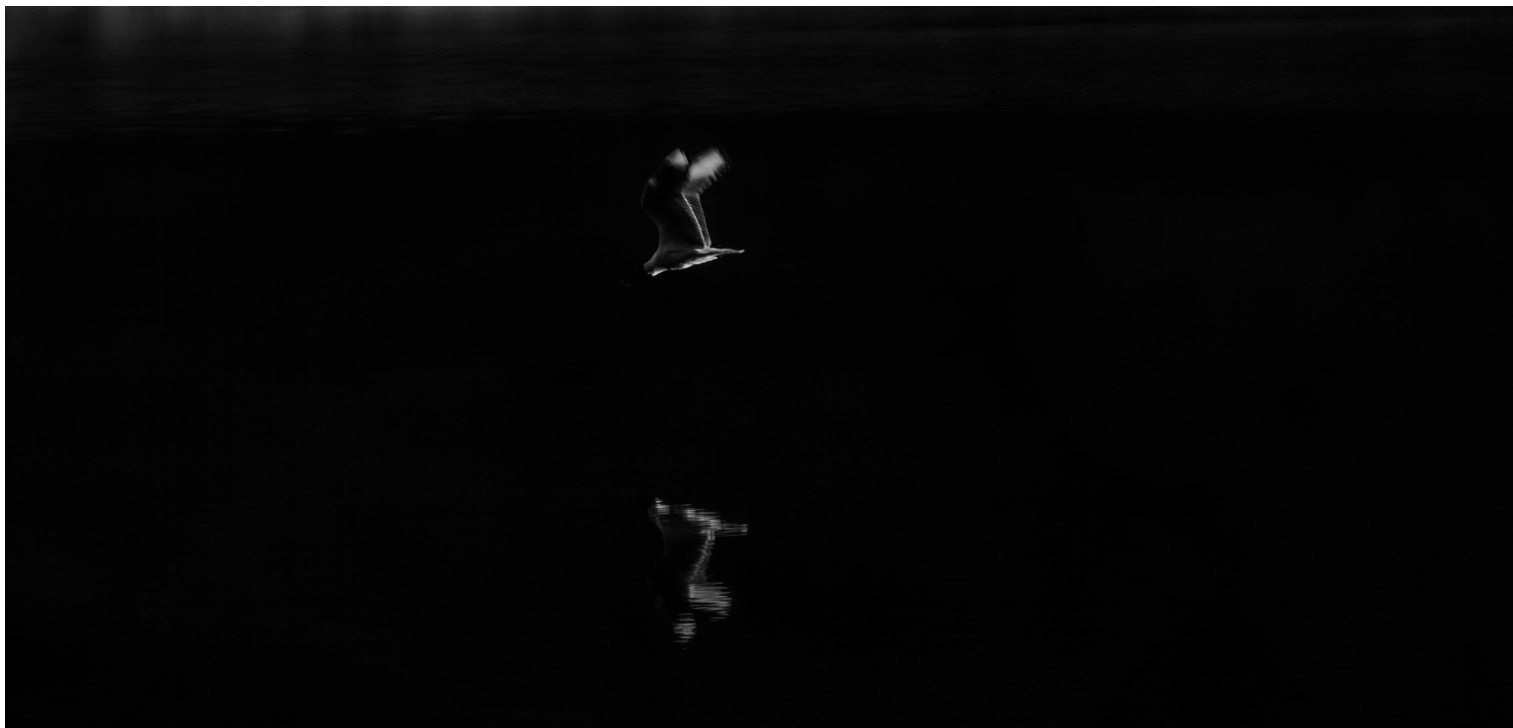
Parque Nacional Cajas, Ecuador (2015)