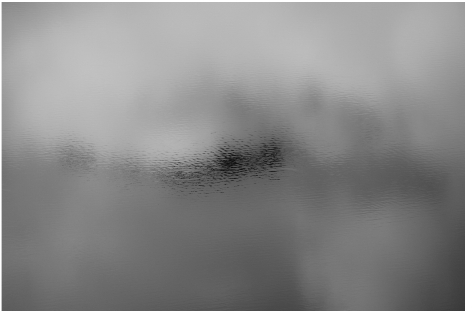
El reflejo en un rincón semejante Parque Nacional Cajas, Ecuador (2015)