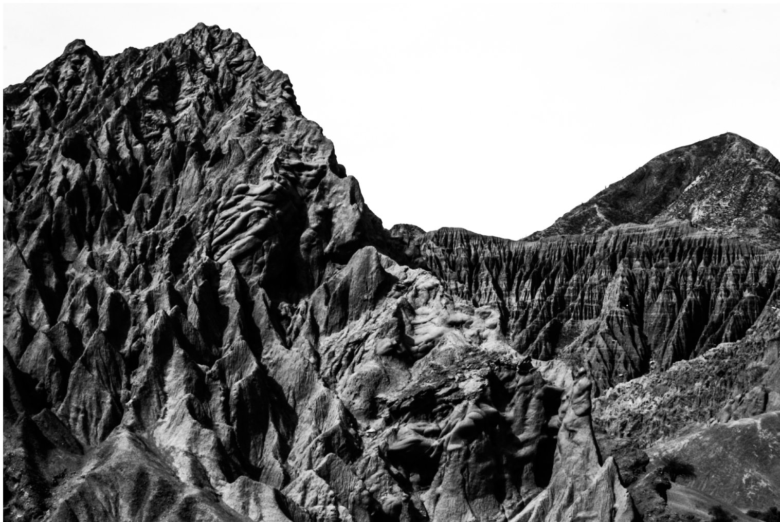
Montaña de 7 colores, Argentina (2010)