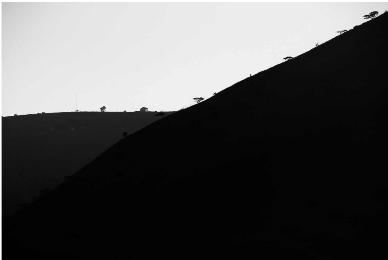
Valle de Yunguilla, Ecuador (2018)