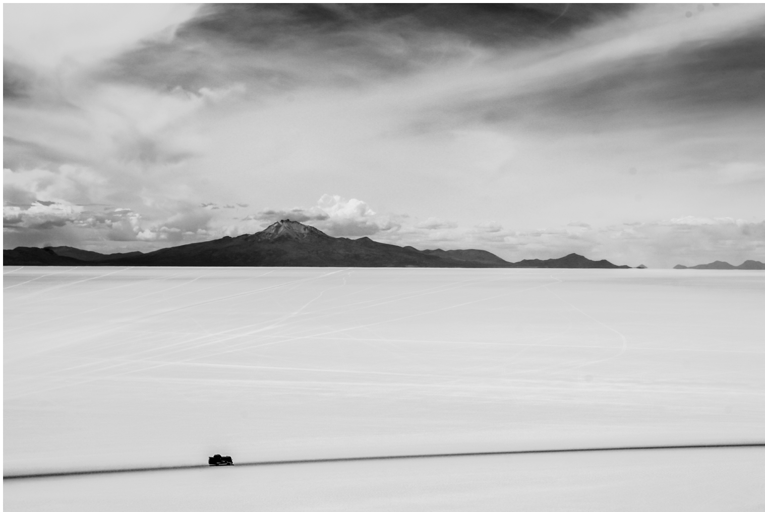
Los mapas que atraviesan el cuerpo Salar de Uyini, Bolivia (2010)