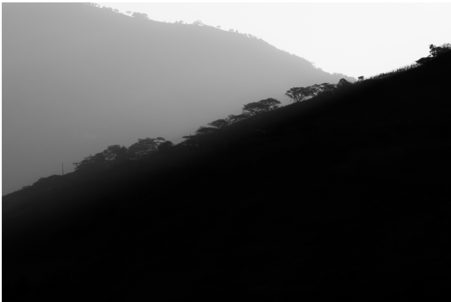
Valle de Yunguilla, Ecuador (2018)