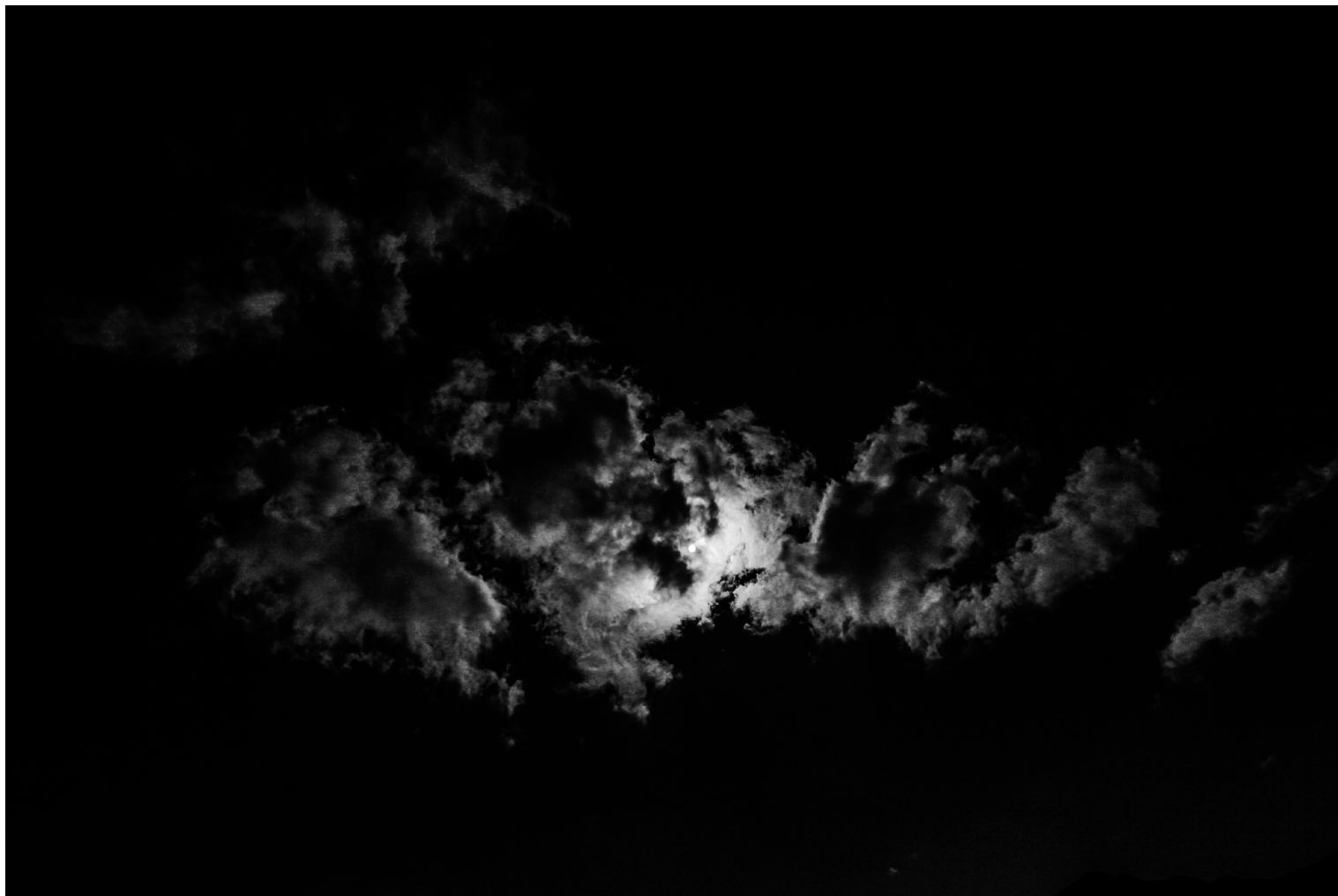
Cuenca, Ecuador (2015)