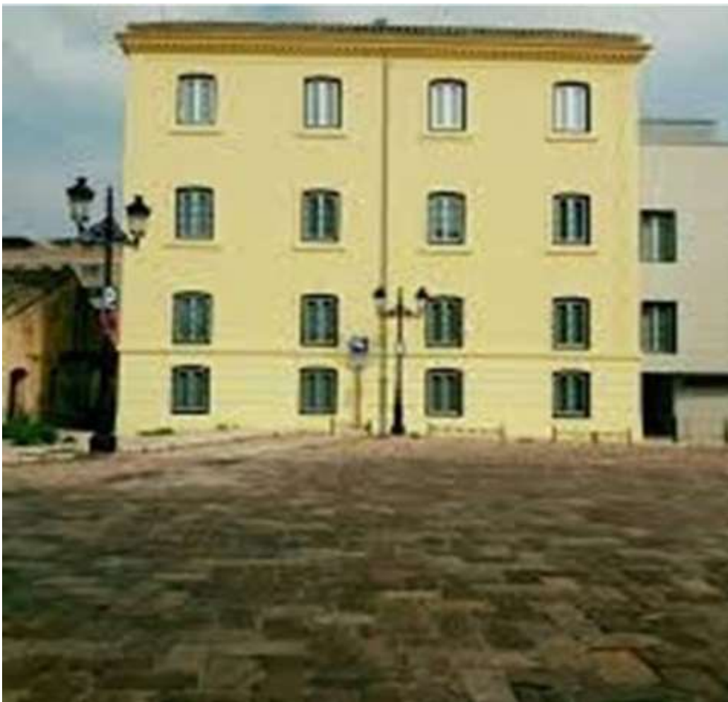
Actual sede de la Biblioteca Suecana