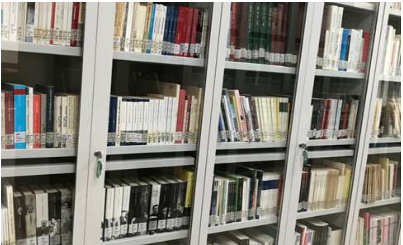
Libros de autores suécanos y/o temática suecana