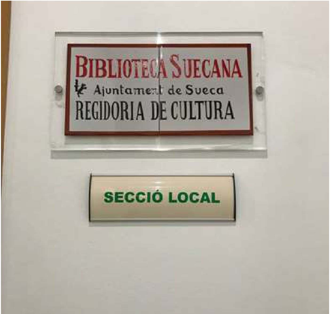
Biblioteca Suecana. Biblioteca Pública Municipal de Sueca

Ysabel Meseguer Serrano / Auxiliar de Biblioteca