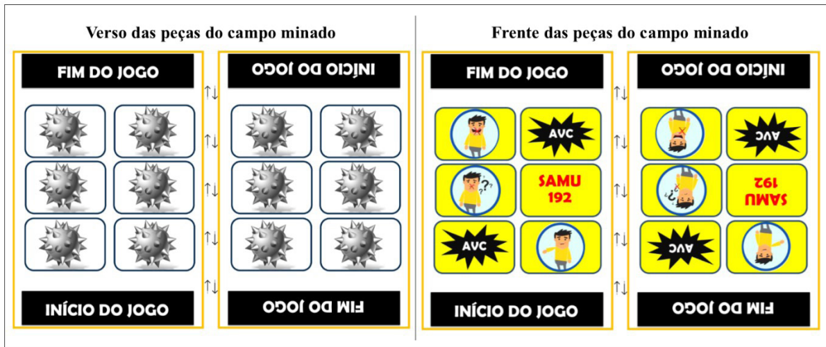
Figura 1. Estructura del juego educativo “Campo Minado – Cuidado con el ACV” (en portugués). Brasil, 2020

En la Figura 1 se presenta la estructura de la tecnología construida e implementada en todas las sesiones de la acción educativa, mostrando la cara anterior y posterior del juego, respectivamente.