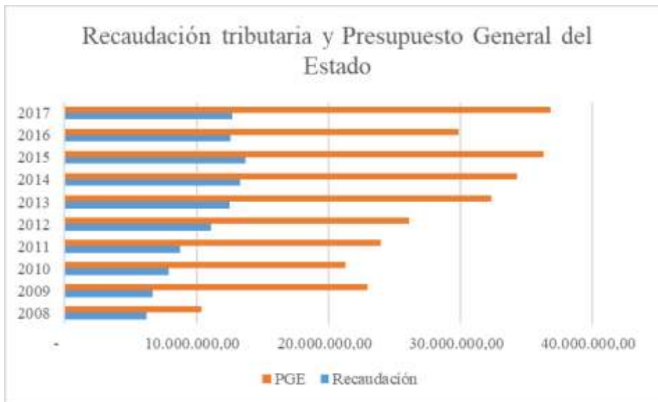
Figura 1. Recaudación tributaria y PGE 2008 al 2017