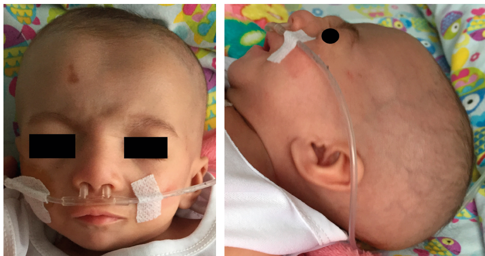
Figura 2. Fotografías de la paciente con microcefalia, cara redonda, hipertelorismo, micrognatia, y pabellones auriculares de implantación baja y dismórficos.

El servicio de Cardiología Pediátrica realizó ecocardiograma, donde se encontró una comunicación interventricular (CIV) perimembranosa subaórtica de 8 mm con mecanismo parcial de cierre, que dejaba dos orificios, uno apical de 3,3 mm y otro proximal de 2,2 mm; y una comunicación interauricular (CIA) tipo ostium secundum (OS) de 4 mm. El 12 de diciembre de 2017