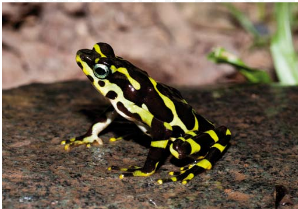
Rana Arlequin, Atelopus spurrelli Capurganá, Chocó Alejandro Campuzano Zuluaga