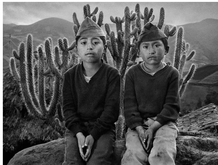
Figura 1 – Fotografia da série “outras Américas” – Equador, 1982

Fonte: BRASIL ON LINE (Imagem: divulgação/Sebastião Salgado), 2022