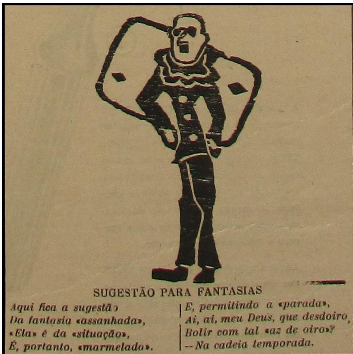
Figura 2 – Sugestão de fantasia