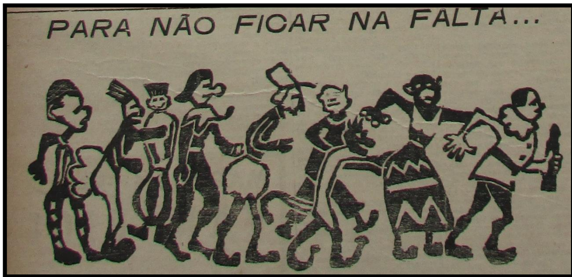
Figura 1 – Para não ficar na falta