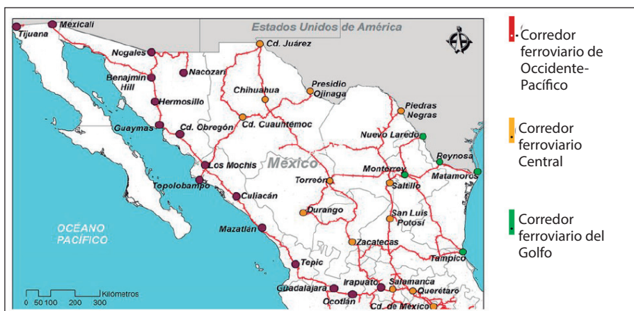
Rutas ferroviarias utilizadas por migrantes