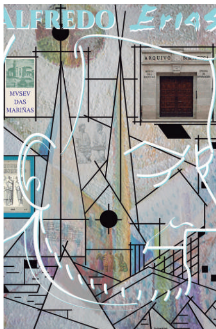
Portada do programa, realizada por Xoán Andrade Vidal.

concurso-oposición, se estableció la obligatoriedad de residencia en nuestra ciudad.