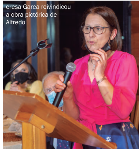
eresesa Garea reivindicou a obra pictórica de Alfredo