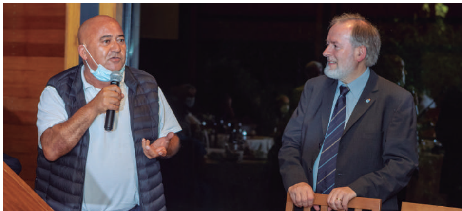
Intervención do alcalde de Abegondo, José Antonio Santiso Miramontes.