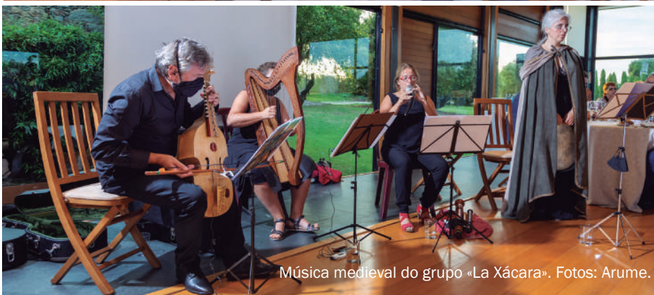
Música medieval do grupo «La Xácara».