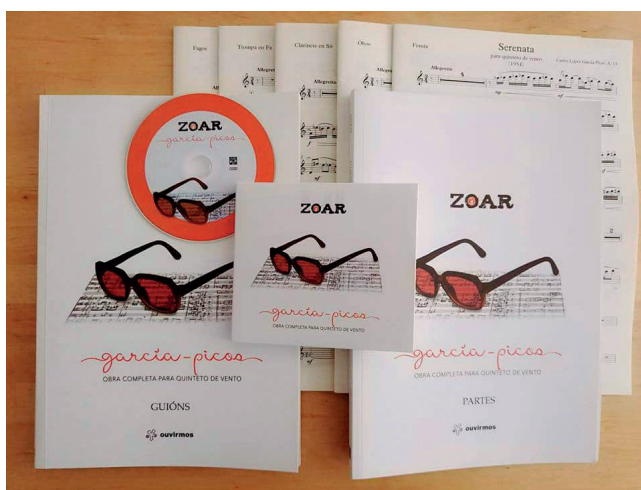
Fig. 02. Partituras e CD García-Picos. Obra completa para quinteto de vento, Zoar Ensemble, Ed. Ouvirmos, 2018.

Ese mesmo obxectivo de reivindicación da súa figura como representante da galegitude e da vangarda musical bonaerense e galega foi o que impulsou neste ano 2022 diversos actos que se están a desenvolver para conmemorar o centenario do nacemento de García-Picos e que xa involucrou a institucións como o Consello da Cultura Galega, a Deputación Provincial da Coruña, o Grupo Organistum da Universidade de Santiago de Compostela, a orquestra Real Filharmonía de Galicia ou a Orquestra Sinfónica de Galicia.