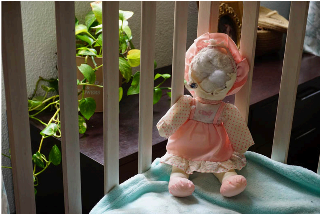
Figura 2. Autoras (2021). Muñeca en la cuna. Fotografía de María Méndez Suárez (2021).