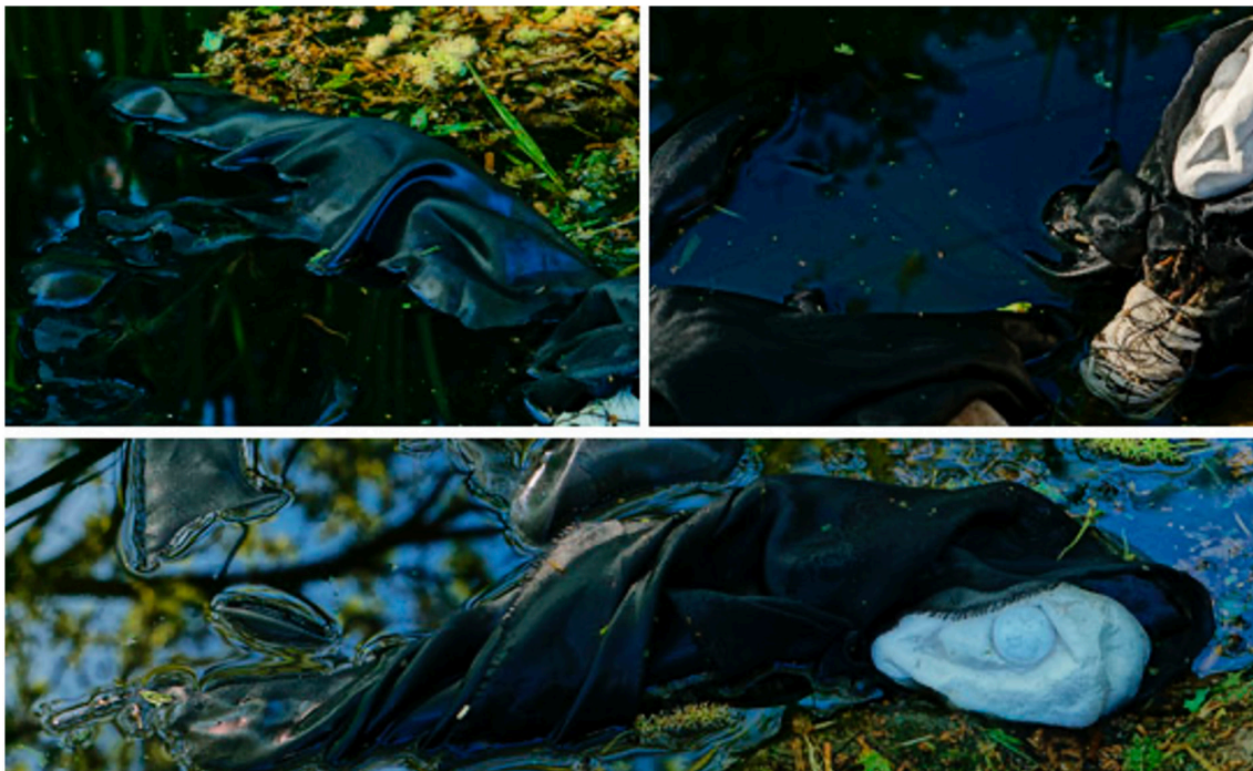
Figura 4. Autoras (2021). Miedo. Fotoensayo compuesto por tres Fotografías de María Méndez Suárez (2021). Miedo I-III.

DOI: https://dx.doi.org/10.17561/rtc.23.7037 Investigación