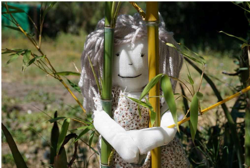
Figura 15. Autoras (2021). Armonía.