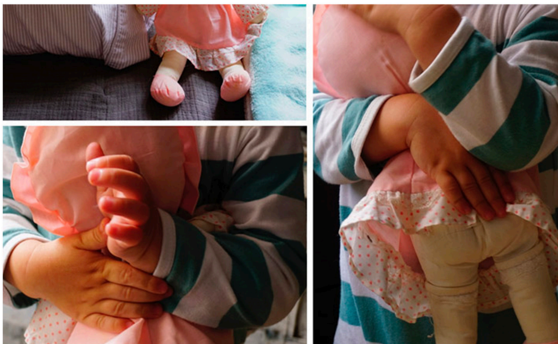
Figura 1. Autoras (2021). El origen de la creación. FOTOENSAYO compuesto por tres FOTOGRAFÍAS de María Méndez Suárez (2021) El origen de la creación I-III.

De acuerdo con López Fernández-Cao (2015), la creación de una obra artística es un compromiso con el objeto creado, con lo que representa y con la vida misma. Es un sostén emocional que nos ayuda a comprender la vida y, en algunos casos, a negociar con ella, para hacerla más soportable, más accesible. Así como el objeto transicional de Winnicott (1971) sosiega el llanto en los primeros momentos de la vida, la creación surge entre las manos de su creador protegiéndola, hasta que la obra se vuelve independiente, compartida y el espectador y la cultura se apropian de ella. Las emociones aparecen de forma natural ante la presencia de una creación y, en este sentido, la cultura condiciona la expresión y manifestaciones emocionales en función del lugar de origen de la persona. En Europa podemos distinguir emociones frías atribuidas al norte y cálidas asociadas al sur. En base a ello surgen prejuicios hacia aquellas sociedades más expresivas emocionalmente, tachándolas de desordenadas y escasamente productivas (Antón, 2015).