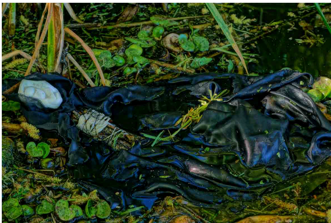
Figura 5. Autoras (2021). Paralizadas por el miedo.