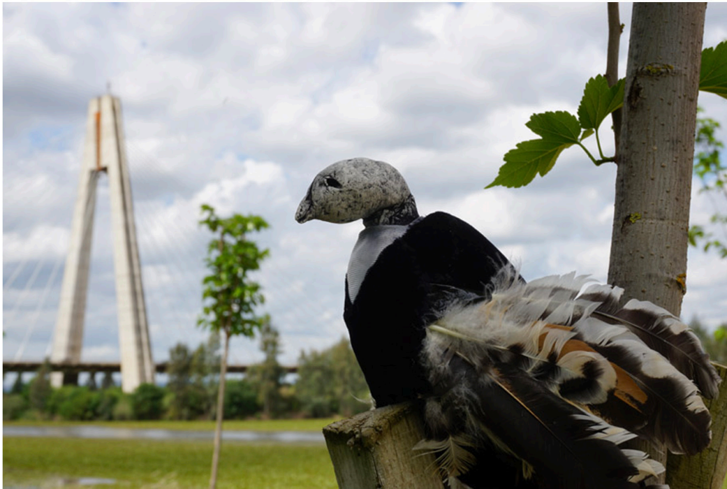
Figura 11. Autoras (2021). Reconciliación con la naturaleza.