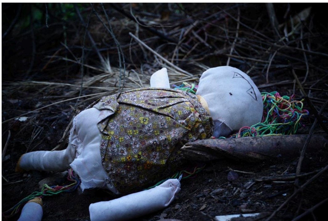
Figura 8. Autoras (2021). Recuerdo.