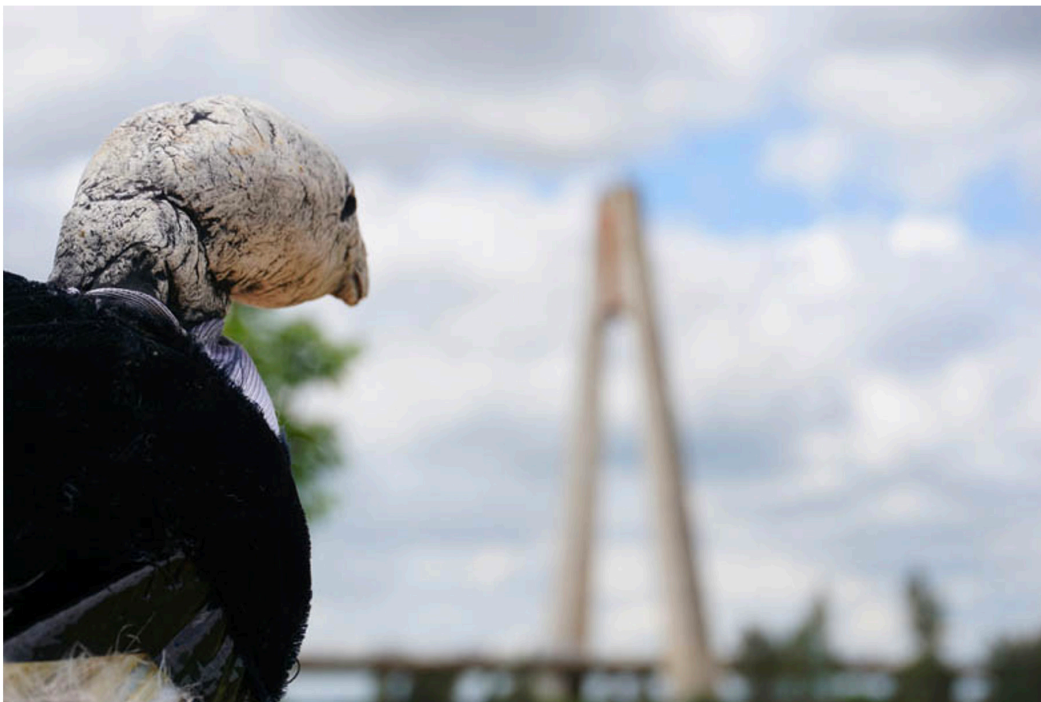
Figura 12. Autoras (2021). Detenerse y mirar.