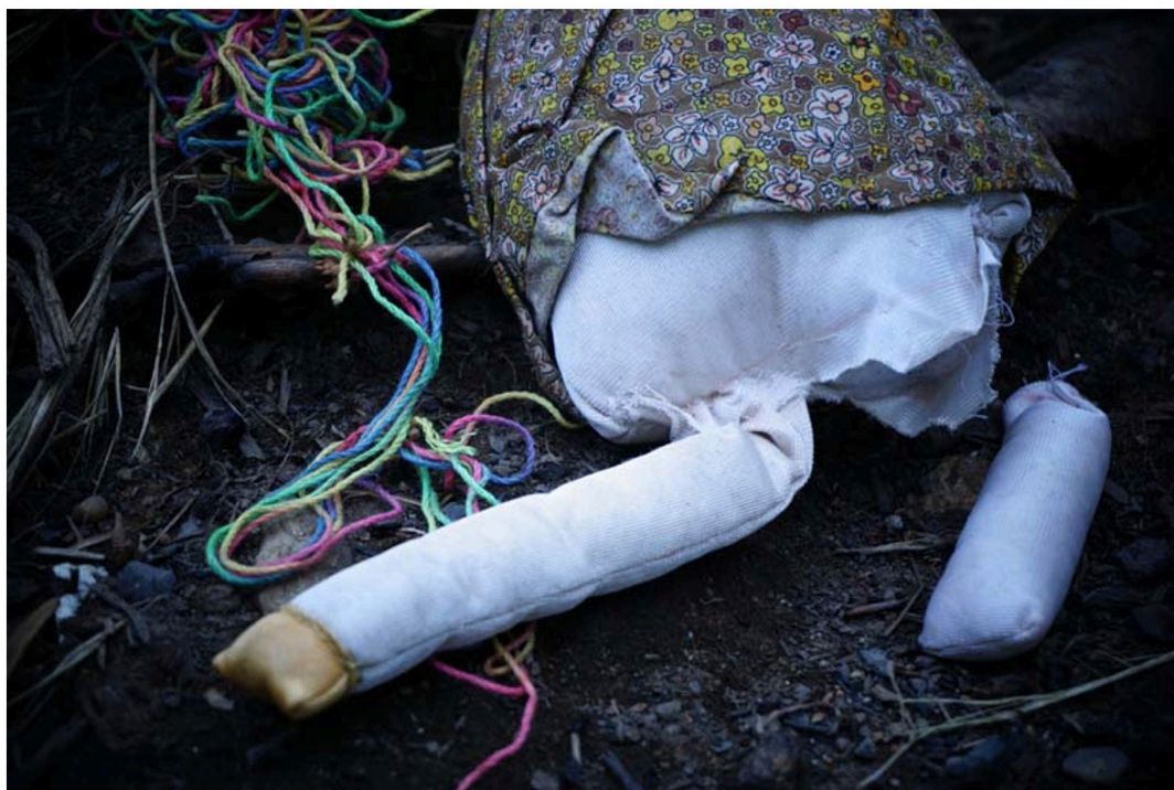
Figura 9. Autoras (2021). Repetición.

DOI: https://dx.doi.org/10.17561/rte.23.7037 Investigación