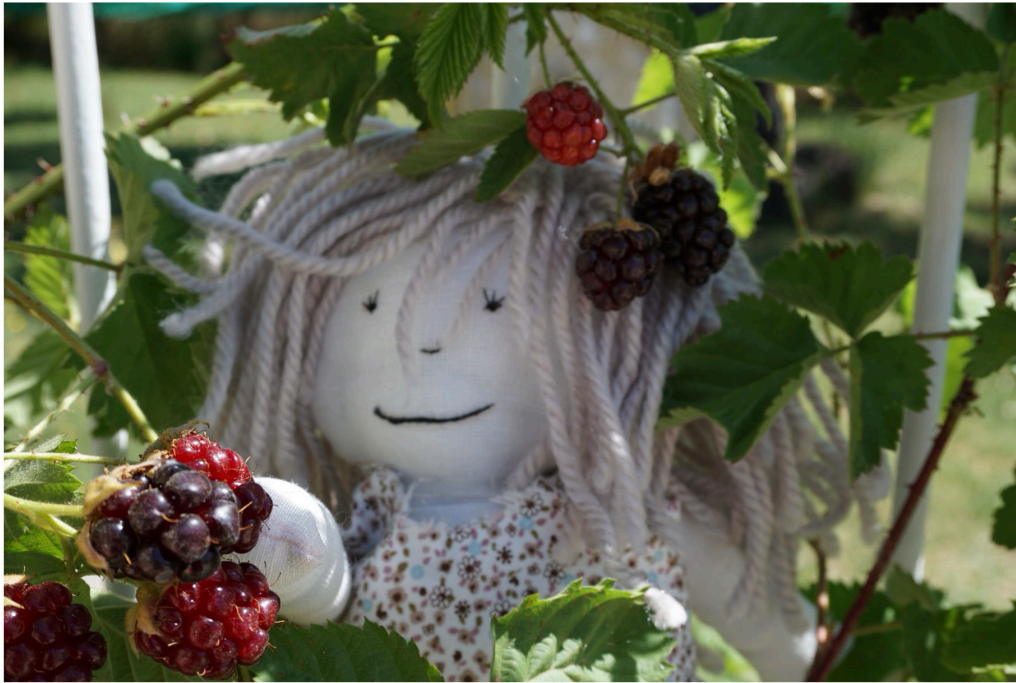
Figura 14. Autoras (2021). El jugo de la vida.