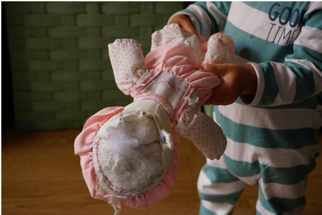
Figura 3. Autoras (2021). Jugando con la muñeca.