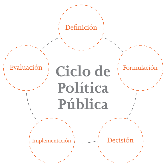
Figura 1. Ciclo de la Política pública