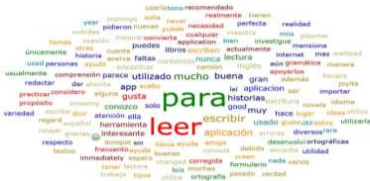
Gráfica 3. Nube de palabras opinión personal de estudiantes sobre el uso de Wattpad .

Por último, se presenta una nube de palabras que revela las opiniones expresadas por los alumnos acerca del uso de la aplicación Wattpad para mejorar sus habilidades de escritura. En la Gráfica 3 se observa que se identifica a Wattpad como una herramienta valiosa para la leer, poniendo en primer término está habilidad.