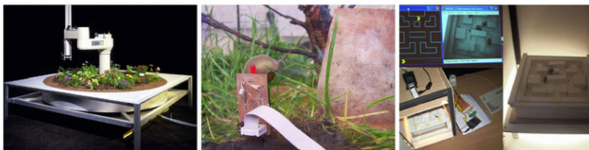
Figura 2. (de izquierda a derecha) Telegarden 1995 (Goldberg, n.d.), Real Snail Mail 2006 (Vickyisley, 2008), Bug Man 2006 (Technovelgy, n.d.).

este artículo es abordar la presencia de animales en las obras interactivas, así como investigar las relaciones que emergen de la interacción de los diferentes componentes de estos sistemas (audiencia, animales, computadora) desde una perspectiva centrada en el ser humano.