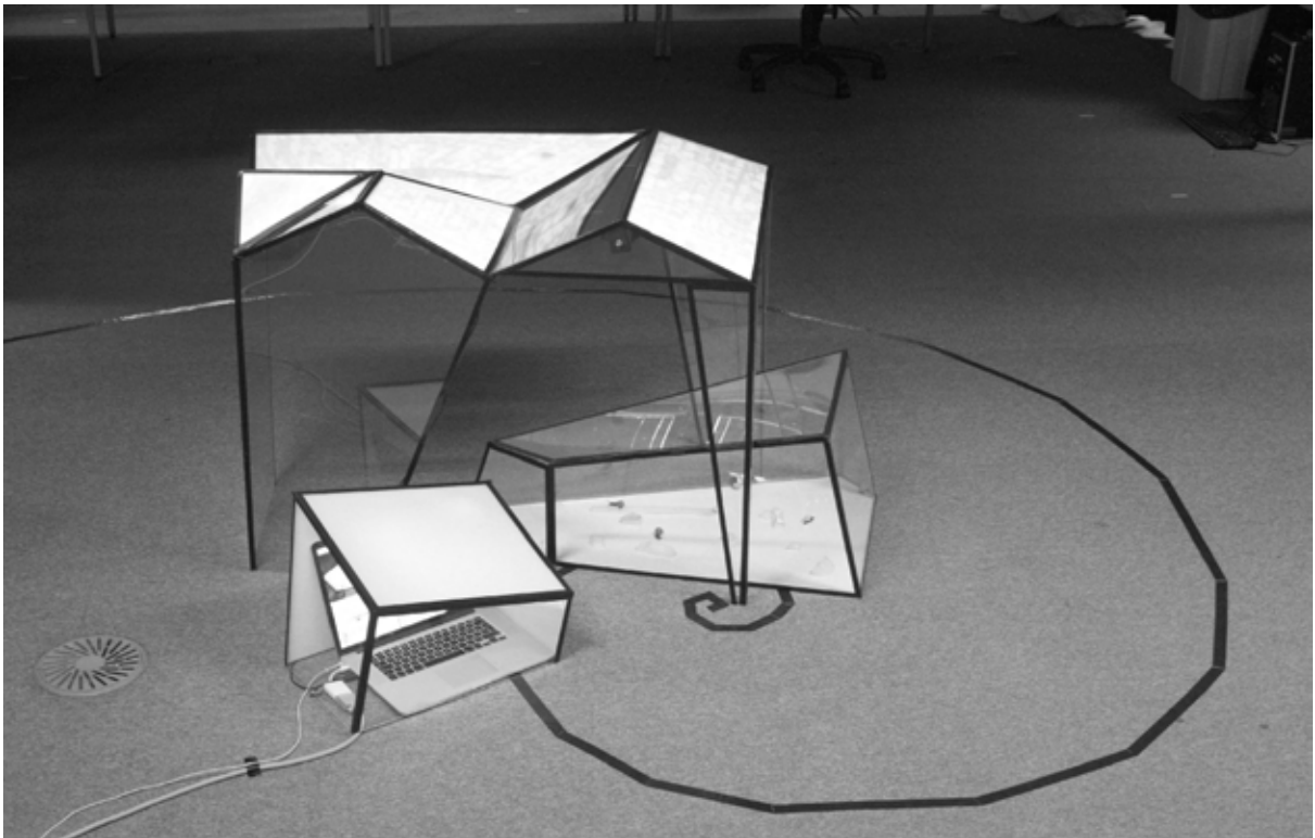
Figura 3. Snail's Place .

que combina diseño de objetos y gráficos digitales en un ambiente de realidades mixtas para presentar un diálogo entre mapas físicos y mapas virtuales (figura 3). Representando una ciudad ubicada a 3000 m.s.n.m en los andes, un grupo de caracoles habita un terrario diseñado donde la estética se ha construido en relación con este lugar en específico (Quito). El movimiento de los caracoles activa un mapa digital que añade información adicional a la representación de este ambiente en la capa superficial del objeto. Ambos, el espacio concebido (i.e. el mundo físico), así como, el espacio percibido (i.e. definido por la experiencia personal del artista en la ciudad), permiten al espectador encontrar el espacio vivido (Lefebvre, 1991 en Purcell, 2002), en otras palabras, la obra presenta el cuadro complejo de un lugar existente a miles de kilómetros del lugar en el que fue presentado (Nottingham).