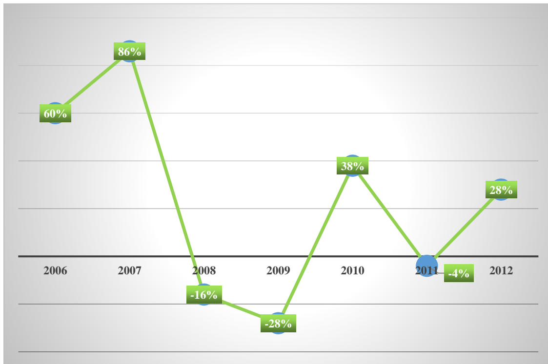
Figura 4. Variación productiva en tasas de crecimiento, 2006-2012. Fuente: PNUD, Perfil productivo municipio Pueblo Rico - Risaralda... , 51.

Por otro lado, es necesario tener en cuenta que las tasas de crecimiento económico al interior del municipio “presentan un comportamiento dinámico, con cambios interanuales drásticos que muestran una baja estabilidad en la economía local. Dicha situación puede derivar en importantes cambios en cuanto a la calidad de vida y la dificultad en la consolidación de las actividades económicas de manera exitosa” 8 .