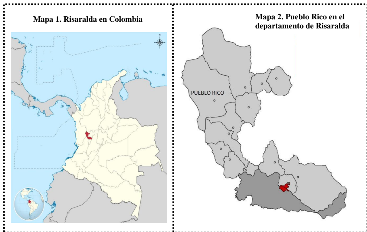
Figura 1. Ubicación de Pueblo Rico, Risaralda

Pueblo Rico se encuentra ubicado en el noroccidente del departamento de Risaralda a 97 km de la capital Pereira. Cuenta con una extensión territorial de 1020 km 2 que lo consolidan como el municipio más extenso de la región. Sus límites geográficos son: por el norte limita con el municipio de Mistrató y Bagadó, por el oriente con Apía, Belén de Umbría y Santuario, por el occidente con Tadó y por el sur con Novita Chocó. El municipio se divide en 84 veredas, 2 corregimientos y la cabecera municipal. Tiene una temperatura promedio de 18°C.