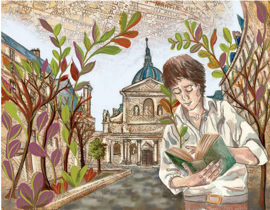
Sin título (2021). Técnica mixta: Paola Saldaña. Prohibida su reproducción en obras derivadas.

La artista propone también un desgarramiento de la realidad que cobra sustancia mediante técnicas que permiten la tridimensionalidad. Con ello, deja en claro la existencia, detrás de cada imagen, de uno o muchos trasfondos complejos, capas de sentido que bien pueden representar distintos momentos del pasado, una amplia gama de impresiones, vivencias y expectativas o, sencillamente, los infinitos matices del sentir y el pensar. De esos mismos estratos surge también una cartografía del deseo, mapas amarillentos sobre los que se dibuja una figura humana que, con los ojos cerrados, una bicicleta en la mente y en el corazón una brújula, reinventa paisajes de latitudes conocidas o por conocer.