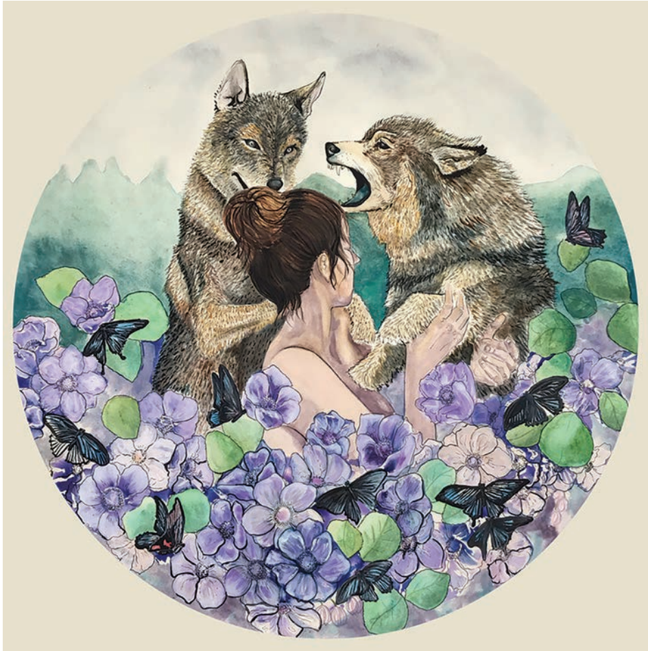
Sin título (2021). Técnica mixta: Paola Saldaña. Prohibida su reproducción en obras derivadas.