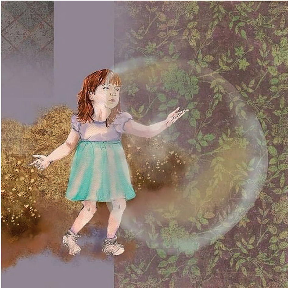
Sin título (2021). Técnica mixta: Paola Saldaña. Prohibida su reproducción en obras derivadas.