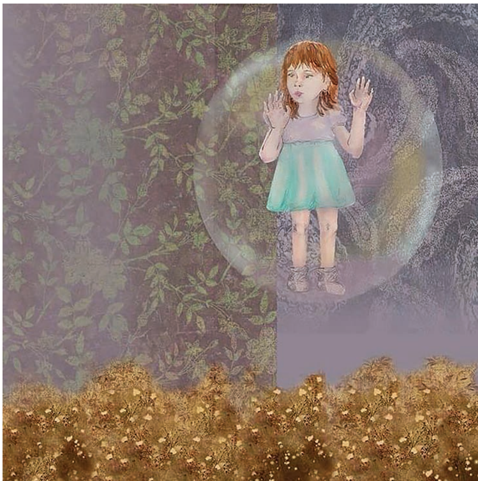
Sin título (2021). Técnica mixta: Paola Saldaña. Prohibida su reproducción en obras derivadas.