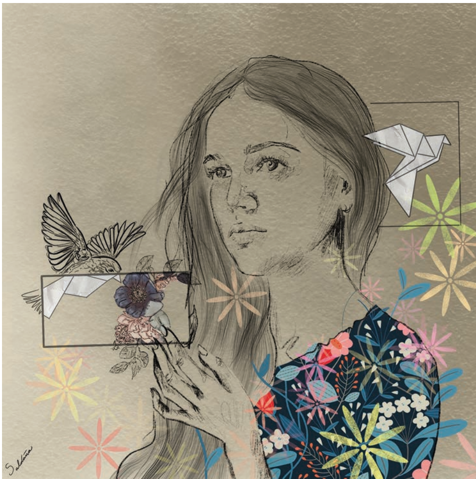
Sin título (2021). Técnica mixta: Paola Saldaña. Prohibida su reproducción en obras derivadas.