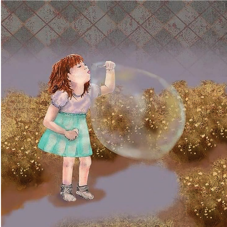
Sin título (2021). Técnica mixta: Paola Saldaña. Prohibida su reproducción en obras derivadas.