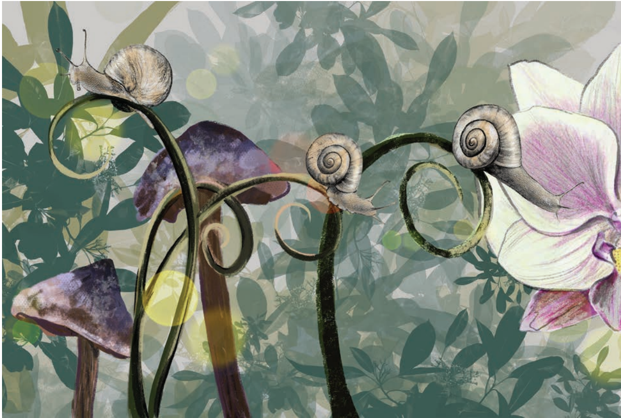
Sin título (2021). Técnica mixta: Paola Saldaña. Prohibida su reproducción en obras derivadas.

Los trabajos de la joven mexiquense constituyen también un homenaje al propio proceso creativo. Manos iluminadas por luces y sombras, una serie de trazos que simulan las teclas de una máquina de escribir y el desbordante destello de energía de unas flores que remiten a los glifos del lenguaje nos hablan de la necesidad imperiosa de dar forma a aquellos vuelos de paloma que agitan el pecho de quien sueña con lápiz, tintas de colores y papel.