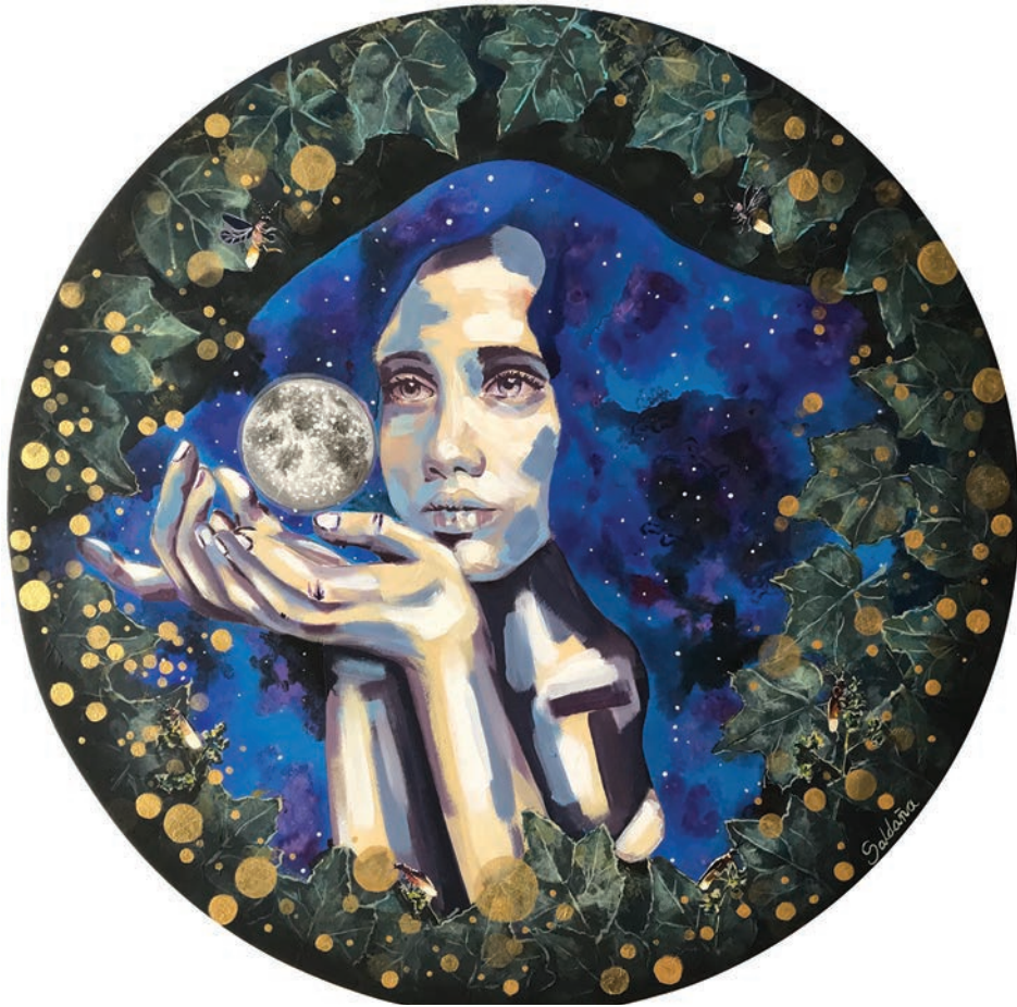
Sin título (2021). Técnica mixta: Paola Saldaña. Prohibida su reproducción en obras derivadas.

Paola Saldaña cultiva también su propio jardín inundado de flores y hojas que remiten a una estética vintage y configuran una especie de desgastados tapices, marco perfecto que abraza sin palabras esos rostros que miran a lo lejos en sus cárceles de tela y papel, perdiéndose en ensoñaciones o, quizá, pensándose y pensándonos mientras los espiamos desde nuestros asientos. Un juego especular se desata en esos ojos que nos contemplan desde el lienzo. Somos en la medida en que los demás nos observan y nos nombran, afirmación que bien puede extrapolarse al terreno del arte, donde el espectador dota de sentido a la obra, pero la obra también le presta significación, escenario que cuestiona y reinventa lo que conocemos como alteridad.