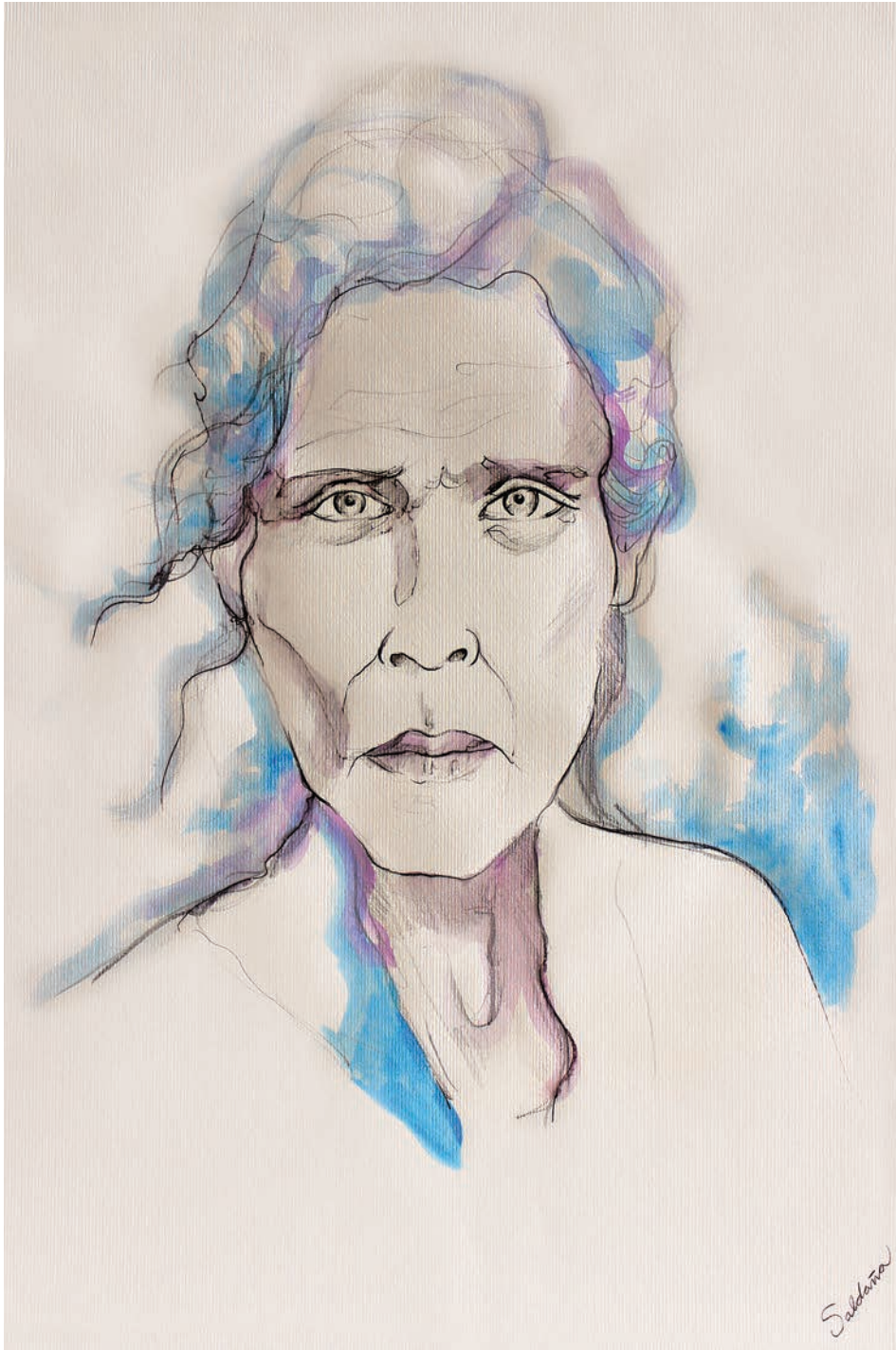
Invierno azul (2021). Técnica mixta sobre papel: Paola Saldaña. Prohibida su reproducción en obras derivadas.