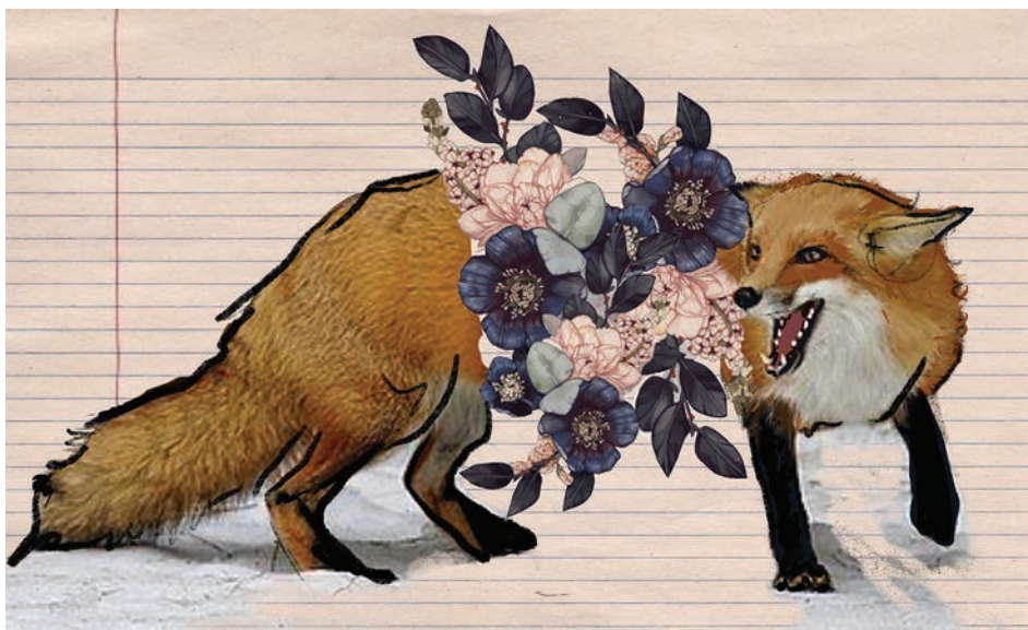
Sin título (2021). Técnica mixta: Paola Saldaña. Prohibida su reproducción en obras derivadas.

En ese mismo tenor, encontramos una nostalgia de la naturaleza que se plasma en imágenes zoomorfas, cuyo silencio no hace más que devolvemos a los ecos de la tierra y los seres que la habitan. Zorros, venados, peces, ballenas, mariposas y aves encuentran su hogar al lado de las mujeres de los retratos, acompañando su descanso, sugiriendo una interesante fusión entre lo humano y lo animal en medio de una atmósfera bucólica y onírica. La presencia del mar y sus habitantes nos sumerge también en esas fosas abisales que simbolizan los misterios que, a veces insinuándose, pero sin dejarse ver del todo, palpitan en el corazón de la artista.