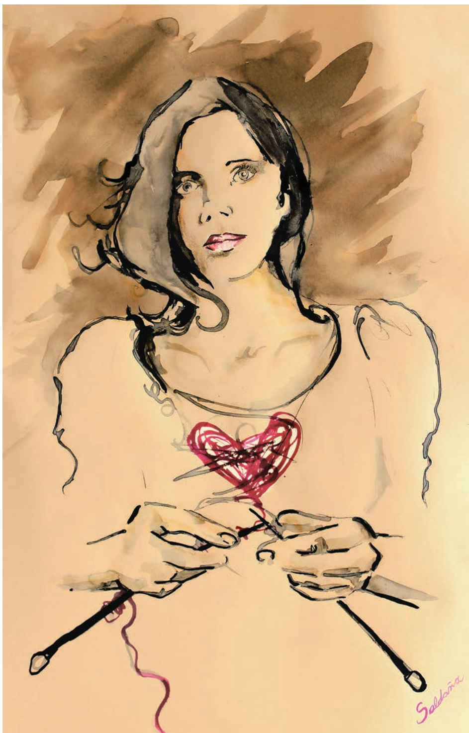
Sin título (2021). Técnica mixta: Paola Saldaña. Prohibida su reproducción en obras derivadas.