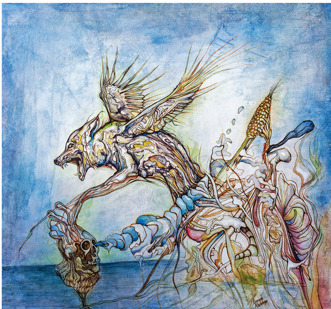
Brunas y lluvia (2013). Farmacollage : Leonardo Montelongo Prohibida su reproducción en obras derivadas.