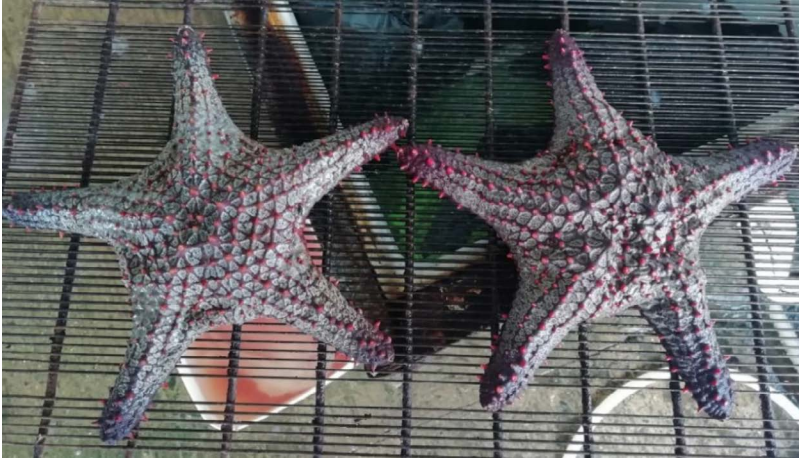
Fig. 3. Ejemplares de Pentaceraster cumingi capturados con trasmallo de fondo (2020) y comercializados en el puerto artesanal de Acajutla, El Salvador.