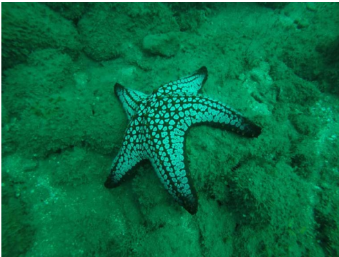
Fig. 1. Individuo de P. cumingi fotografiado en el 2017.

La Pecerita) del arrecife rocoso de Los Cóbanos, que se ubica dentro del Área Natural Protegida (ANP) Complejo Los Cóbanos (Fig. 2) a 11 km al Oriente del municipio de Acajutla, Sonsonate, en la zona comprendida entre Punta Remedios y Barra Salada (ICMARES, 2006). Se establecieron dos transectos paralelos a la costa, en bandas de 30 m de longitud por 2 m de ancho, con una separación de 5 m entre sí, contabilizando y midiendo el radio mayor (R) y radio menor (r) de los organismos encontrados. Se cubrió un área de 120 m 2 por cada punto de muestreo y una superficie total de 720 m 2 .