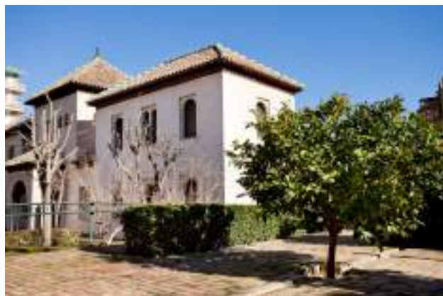
Alcázar Genil, sede de la Fundación Francisco Ayala.