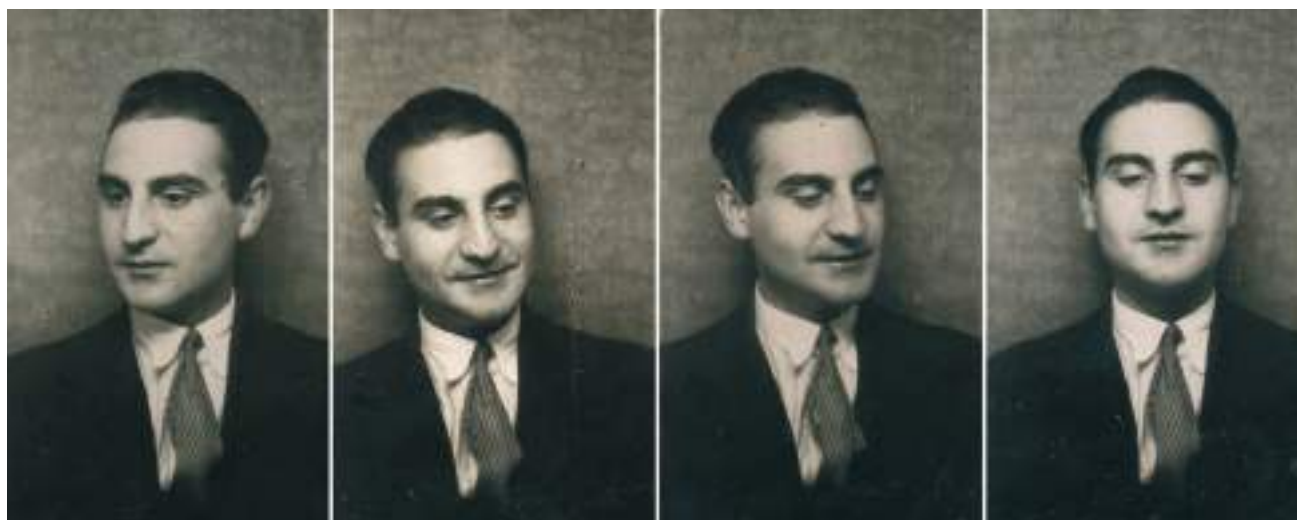
Francisco Ayala, ca. 1926.

Francisco Ayala García-Duarte (Granada, 1906-Madrid, 2009) fue uno de los grandes intelectuales en lengua española del siglo XX. La magnitud de su obra, creada entre Europa y América durante ocho décadas –sus novelas y cuentos, ensayos y artículos se extienden desde 1923 a 2006–, cobra cada vez más relevancia a medida que se van recuperando textos, estudiando las publicaciones a las que iban destinados, fijando fechas de composición, ahondando en sus relaciones literarias con otros autores, ampliando la información sobre otras de sus actividades profesionales –como la edición y la traducción–, profundizando, en suma, en las circunstancias –culturales, históricas, políticas, personales– que contextualizan su producción. Su vasto legado no hace sino crecer en volumen y en significancia.