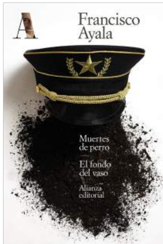
Nuevas ediciones de la obra de Francisco Ayala en Alianza Editorial.