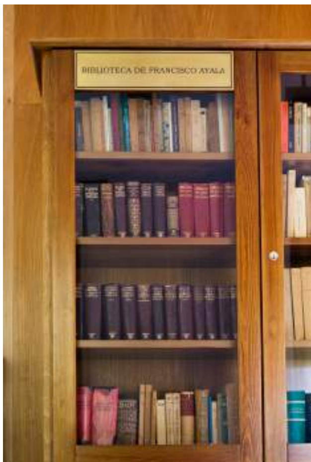
Biblioteca personal de Francisco Ayala. (Foto: Krum Krumov. Archivo de la Fundación Francisco Ayala).

distribuyen los espacios de trabajo de la Fundación, que se componen de una sala de actos, donde se realizan talleres y se recibe a los grupos; el área de biblioteca y museo, donde se exhiben los cuadros pintados por Luz García-Duarte, madre del escritor 3 ; otra sala para investigadores y reuniones; y una zona polivalente para trabajos de archivo y documentación, de administración y de acogida de visitantes. El personal de la Fundación se encarga de tener abierto el monumento y de recibir a las visitas.