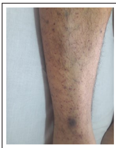
Figura 1. Petequias de distribución simétrica en miembro inferior derecho, equimosis en tercio inferior de menos de 3 cm.

A su ingreso se halla vigil, con signos vitales normales, se constatan petequias y equimosis en ambos miembros inferiores, tronco y abdomen, no sobreelevadas que no desaparecen con la vitropresión sin estigmas de sangrado en las mucosas (Figura 1).