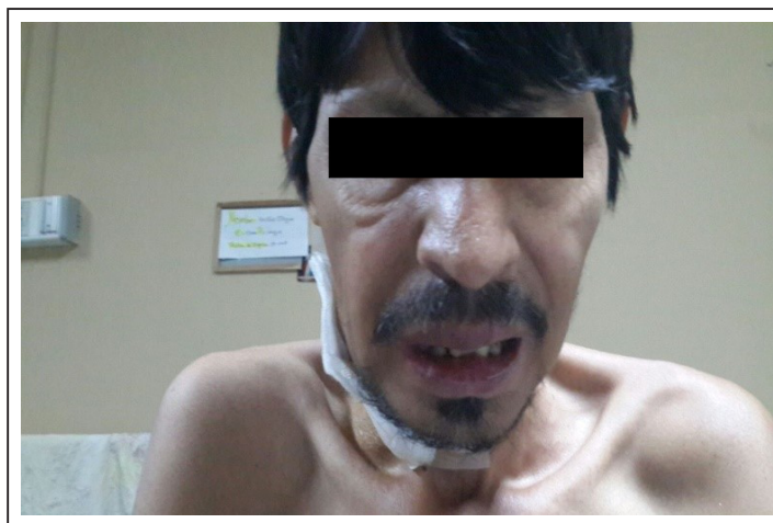
Figura 2. Engrosamiento de las alas de la nariz (nariz de tapir), disminución de la apertura bucal