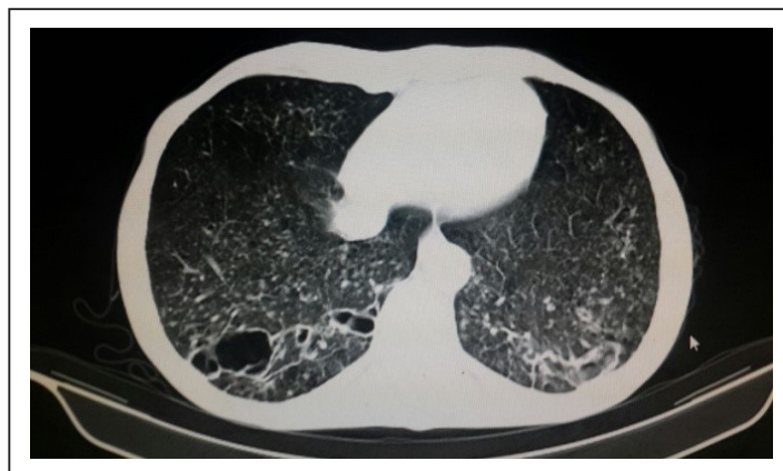
Figura 7. Tomografía de tórax con infiltrado nodulillar, bandas fibróticas y cavitaciones predominantes en pulmón derecho.