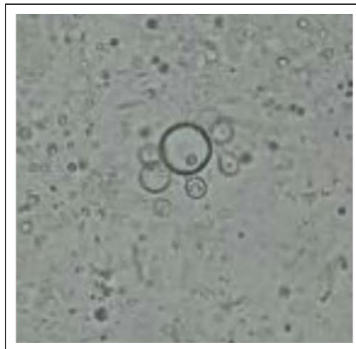
Figura 5. Elemento micótico multibrotante compatible con paracoccidioidomicosis