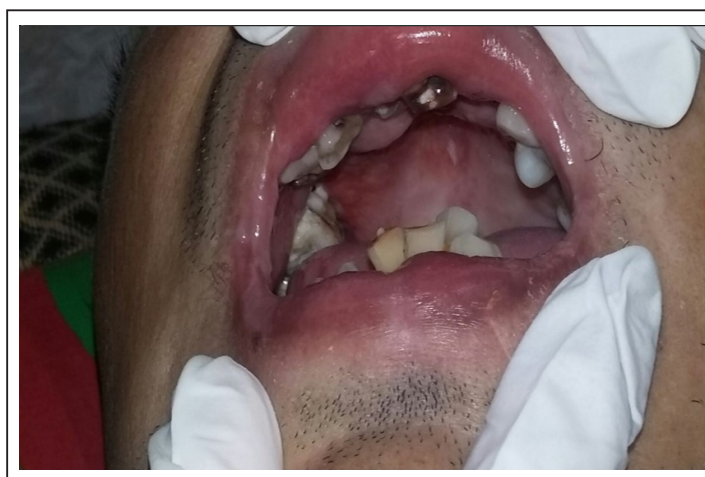
Figura 3. Boca con hipertrofia gingival, piezas dentarias móviles y en mal estado de conservación.