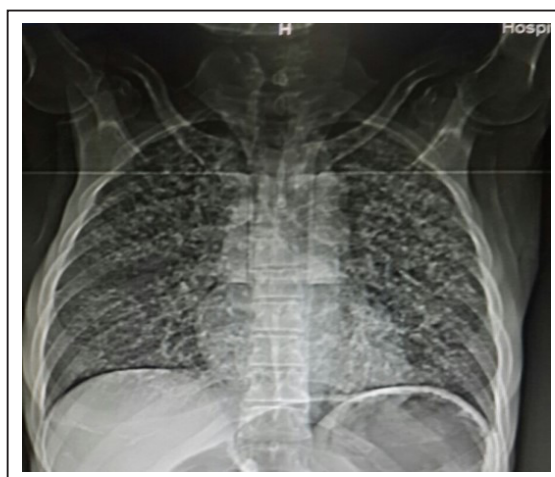
Figura 6. Radiografía de tórax con infiltrado retículo-nodulillar bilateral