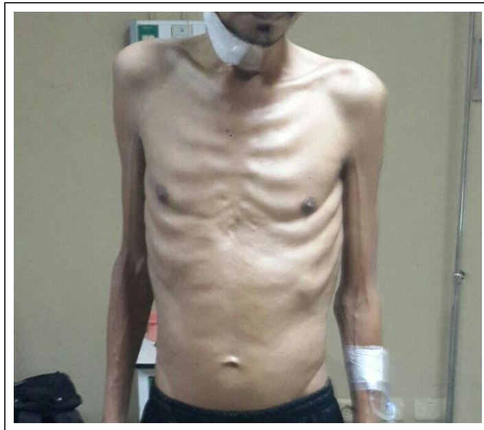
Figura 1. Tórax de aspecto tísico