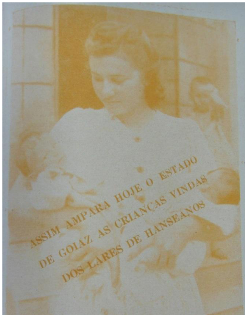
Figura 3 - Propaganda do Educandário Afrânio de Azevedo.

crianças, mas se apresentassem algum sintoma da doença a criança era encaminhada para o leprosário.