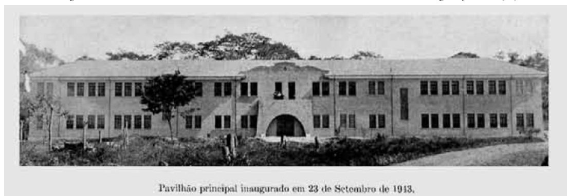
Figura 1 - Vista do Preventório Educandário Afrânio de Azevedo em sua inauguração em 1943