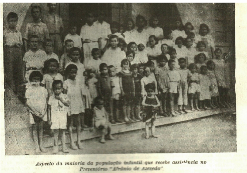
Aspecto da maioria da população infantil que recebe assistência no Preventório “Afrânio de Azevedo”