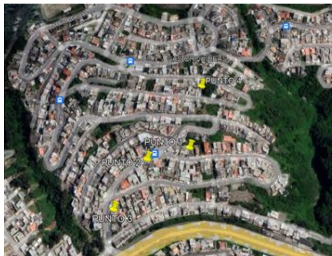
Figura 2. Zona de estudio para mediciones en ubicaciones fijas.

La recolección de datos en este escenario se lo realizó con un teléfono celular en estado estático y sin la ejecución de ningún tipo de servicio. Para la recolección se empleó la aplicación NetMonitor Cell Signal Logging , misma que fue configurada para tomar datos cada segundo durante un mes. La recolección de datos se realizó en 4 puntos de una zona ubicada en el Centro-Sur de la ciudad de Quito, Ecuador que se muestra en la Figura 2; dichos puntos se encuentran alejados de las estaciones base que brindan cobertura a los usuarios del sector. Se debe mencionar que en cada uno de los puntos se registraron las mediciones durante una semana con una toma de muestras en cada segundo. Los puntos de estudio; a pesar de ser estáticos, mantenerse constantes las condiciones circundantes de propagación y encontrarse relativamente cerca de las estaciones base; presentan una variación notoria de los parámetros de la señal recibida, lo que permite pensar que dicho comportamiento se puede deber a la cantidad de usuarios conectados simultáneamente a la red en el transcurso del tiempo. Las mediciones se las realiza con la finalidad de determinar la calidad de la señal de la red móvil recibida en dicha zona en base al análisis del comportamiento de los parámetros de RF.