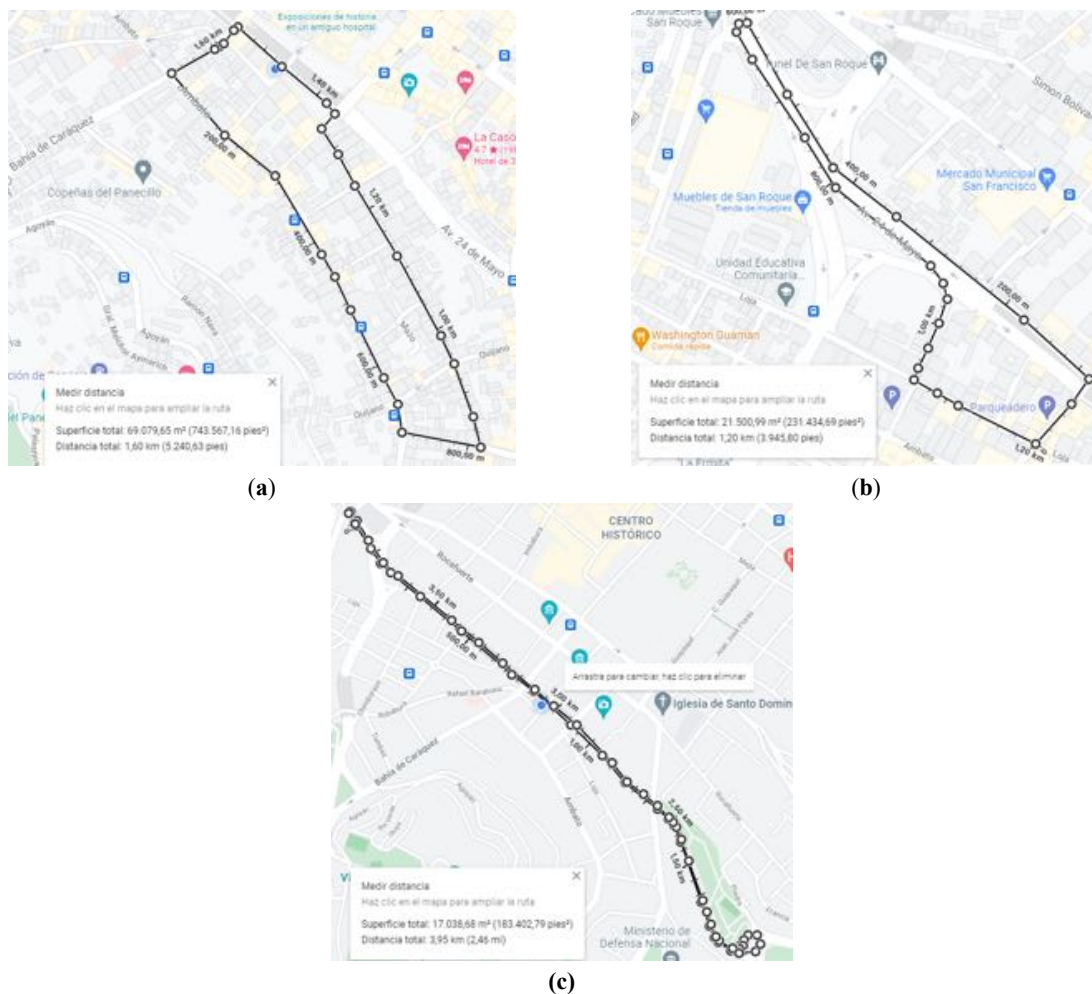
Figura 3. Rutas de estudio para conexiones en movimiento: (a) Ruta A de 1.60 Km; (b) Ruta B de 1.20 Km; (b) Ruta C de 3.95 Km.

La recolección de datos en este escenario se realizó manteniendo una comunicación permanentemente a la red celular, es decir, mediante la ejecución de una conexión de datos constante que en este caso de trató de una descarga de archivos. Para la recolección se utilizó la aplicación llamada G-NetTrack Pro, ya que otorga datos completos acerca de la red LTE, durante los recorridos y la ejecución de las mediciones los datos se recolectaron cada 3 segundos. Por otro lado, las velocidades del terminal móvil varían desde 1 Km/h hasta sobrepasar los 40 Km/h, esto se debe a que la velocidad máxima permitida dentro de la ciudad de Quito es de 50 Km/h. Para la recolección de los datos se realizan recorridos por tres rutas localizadas en el centro histórico de la ciudad de Quito, Ecuador. Las rutas recorridas se muestran en la Figura 3.