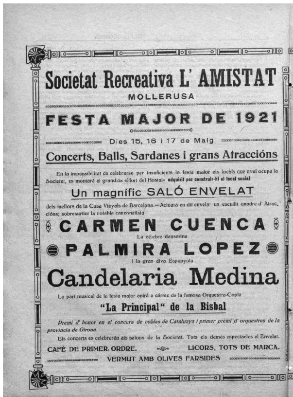
Font: Urgell-Segarra, 68, 12 maig 1921, p. 12.