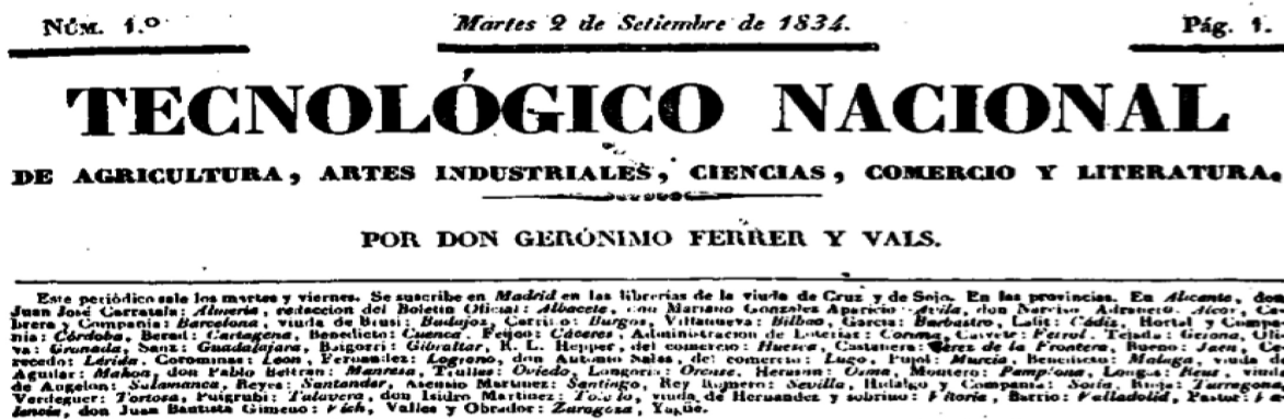
Figura 02: Capçalera del diari Tecnológico nacional, 2 de setembre de 1834.