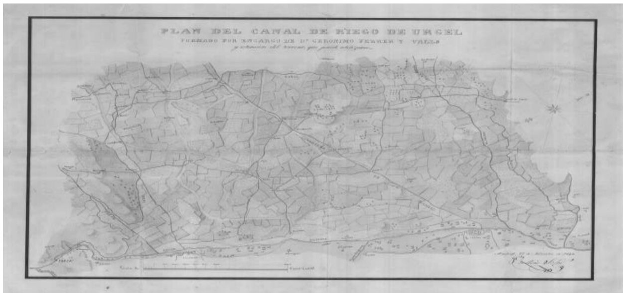
Figura 06. Plan del Canal de riego de Urgel formado por encargo de Don Gerónimo Ferrer y Valls y extensión del terreno, que puede utilizarse (1849).

Finalment Jeroni Ferrer va adoptar el projecte de