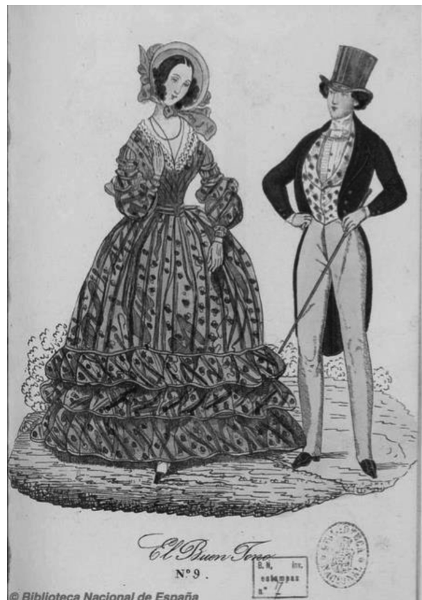
Figura 04: Litografia de la revista El Buen tono , 15 de maig de 1839.