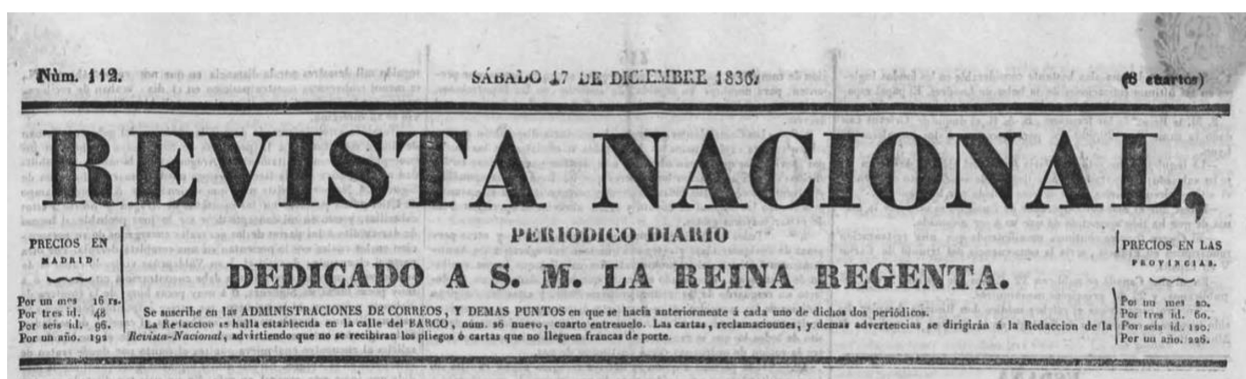
Figura 03: Capçalera de la Revista Nacional , 17 de desembre de 1836. Un article d'aquest diari va ocasionar l'empresonament de Ferrer.