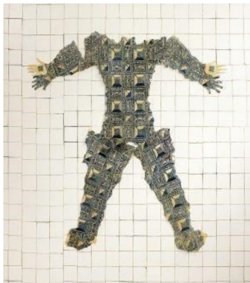
(Fig. 4) Adriana Varejão. Irezumi em ponta de diamante, 1997

Aqui se abrem dois caminhos interpretativos, ou melhor, caminhos de perceptos e afectos, tanto por meio da conceituação de Nora, quanto à de Foucault. O primeiro, com a ideia de lugar de memória ( lieux de mémoire ) e o segundo com o conceito de corpo utópico. Temos o corpo tatuado que é canal de transmissão de uma memória para o futuro, tem sua vontade de memória e é lugar de inscrição simbólica e de linguagem. É o corpo utópico projetando-se para outro espaço.