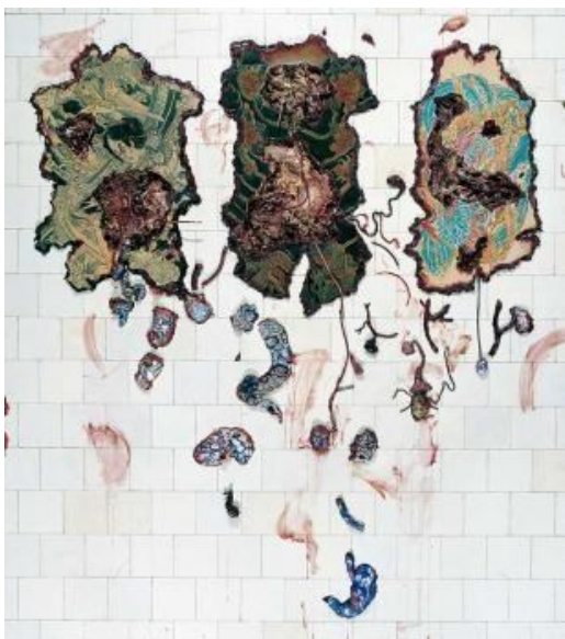
(Fig. 3) Adriana Varejão. Laparatomia exploratória, 1996

transforma de boneca a motociclista a deusa shiva. O nome Cobra dá a ver, sobretudo, a questão da mudança de pele, essa pele barroca, que é pele de linguagem que se metamorfoseia infinitamente em outros significados e referências—travestimento semântico.