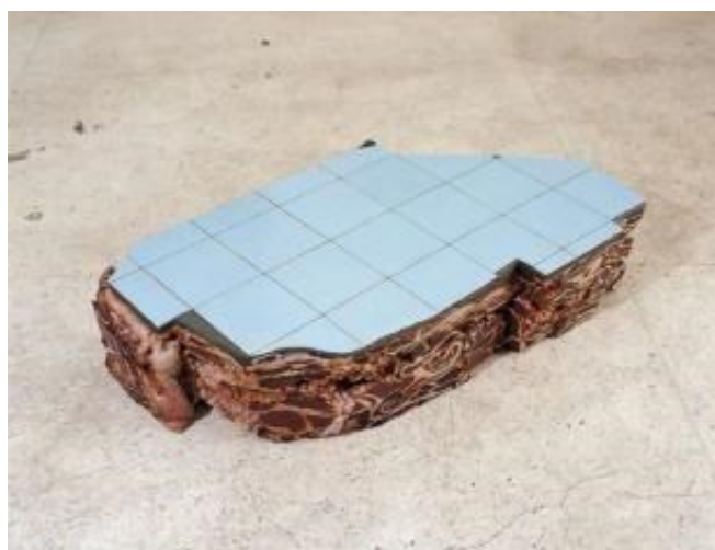
(fig 9) Varejão. Ruína de Charque Caruaru, 2000

Se em Línguas e Cortes , Varejão opera com a carne de modo que essa arrebente a tela—arrebentação do mar barroco revirando-nos—em Charques ela nos demonstra a carne moderada, encerrada dentro de estrutura de azulejo. A carne ganha dimensão definitiva de espessura e pode ser vista por todas as direções. Revira-se da pintura à instalação. É vivenciada novamente como elemento em ocupação de espaço. Arquitetura, agora de carne em ruína. Como em Ruína de Charque Caruaru (fig 9), onde a articulação entre a decadência do arruinado e a sobriedade do tipo de corte de carne que a artista escolhe evidencia-se.