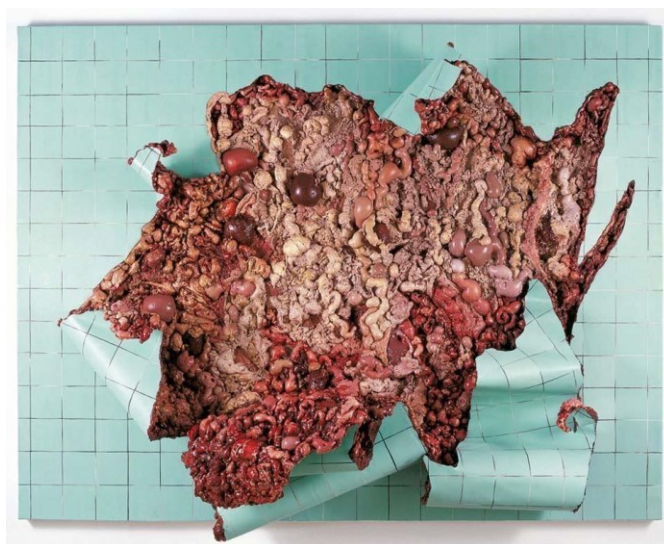
(fig 8) Varejão. Azulejaria Verde em Carne Viva, 2000

Se em Línguas e Cortes , Varejão opera com a carne de modo que essa arrebente a tela—arrebentação do mar barroco revirando-nos—em Charques ela nos demonstra a carne moderada, encerrada dentro de estrutura de azulejo. A carne ganha dimensão definitiva de espessura e pode ser vista por todas as direções. Revira-se da pintura à instalação. É vivenciada novamente como elemento em ocupação de espaço. Arquitetura, agora de carne em ruína. Como em Ruína de Charque Caruaru (fig 9), onde a articulação entre a decadência do arruinado e a sobriedade do tipo de corte de carne que a artista escolhe evidencia-se.