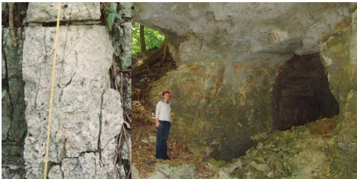
FIGURA 5. Canteras A y B, ubicadas en las inmediaciones del Edificio 33 (Fotografía: Haydeé Orea Magaña, 2005).