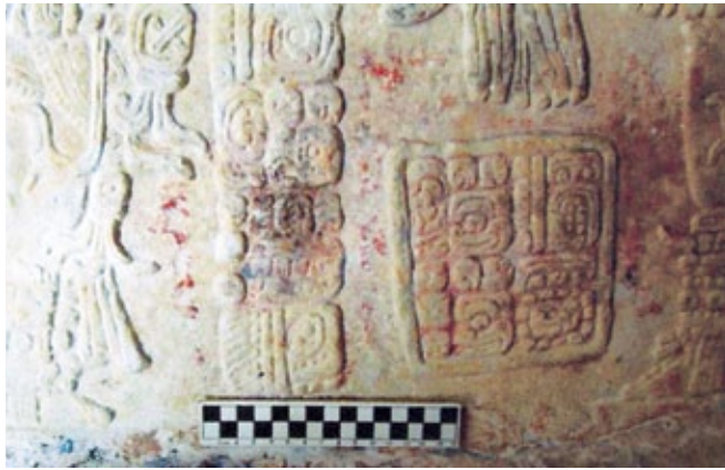
FIGURA 2. Manchas de color en el Dintel 3 del Edificio 33.