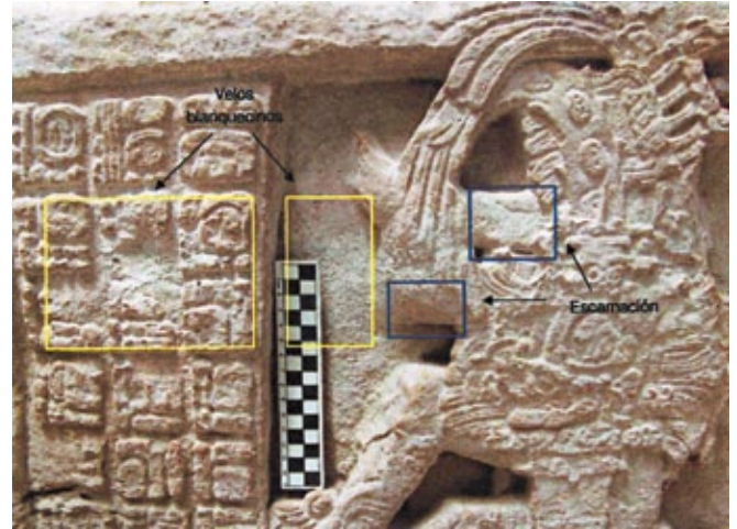
FIGURA 3. Formación de escamas y velos blanquecinos en el escalón VII, de la escalera jeroglífica núm. 2.