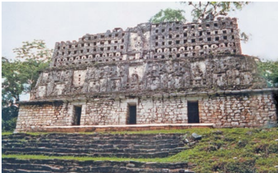
FIGURA 1. Vista frontal del Edificio 33 (Fotografía cortesía: INAH).

Los elementos arquitectónicos y decorativos del Edificio 33 de Yaxchilán integran un discurso esculto-pictórico que señala a este personaje como descendiente de su antecesor, Escudo Jaguar, y legítimo heredero en el puesto de gobernante de la ciudad, posición que ocuparía en la época de mayor apogeo del sitio (Schele y Freidel 1990:283). Desde que se realizaron los primeros registros formales de su estado de conservación, en 1989, estos elementos presentaban deterioros relacionados con sus usos y contexto; sin embargo, no fue sino hasta la temporada de conservación y mantenimiento del año 2003 cuando se registraron nuevas y alarmantes alteraciones en los tres dinteles y la escalinata jeroglífica, tales como velos y concreciones salinas, manchas, formación de escamas, más la aparición de microorganismos debajo de éstas.