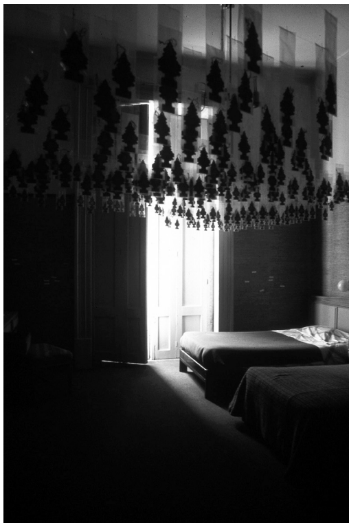
1. Desinfectado (2003).

flexionar sobre el espacio urbano globalizado, utilizando una serie de espacios intersticiales de la capital mexicana. Con ello, nos invita a reflexionar sobre las relaciones identitarias Norte-Sur, en la era post-TLCAN, y propone una nueva semántica donde la fotografía resulta un medio que le permite experimentar la realidad urbana y ‘descubrir’ al Otro.