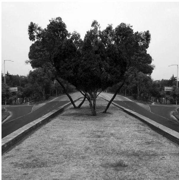
2. Detalle: Río Churubusco (Circuito interior) (2010).

nes, magueyes u otro tipo de vegetación capaz de resistir el imparable vaivén de los automóviles que transitan a toda velocidad por ambos lados de las avenidas. Las fotografías de Bodmer rescatan estos intersticios verdes olvidados e interrogan el espacio de la naturaleza como un hábitat precario varado entre avenidas. Primero captura con su cámara fotográfica tres árboles desde diversos ángulos del camellón que divide el Circuito Interior y, posteriormente, en su taller, manipula el hábitat urbano para obtener una sin-