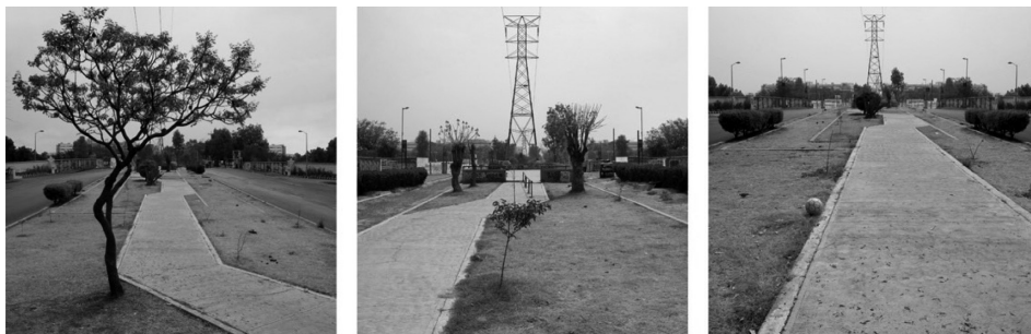
3. Detalle: Avenida Pedro H. Ureña (Eje 10 sur) .