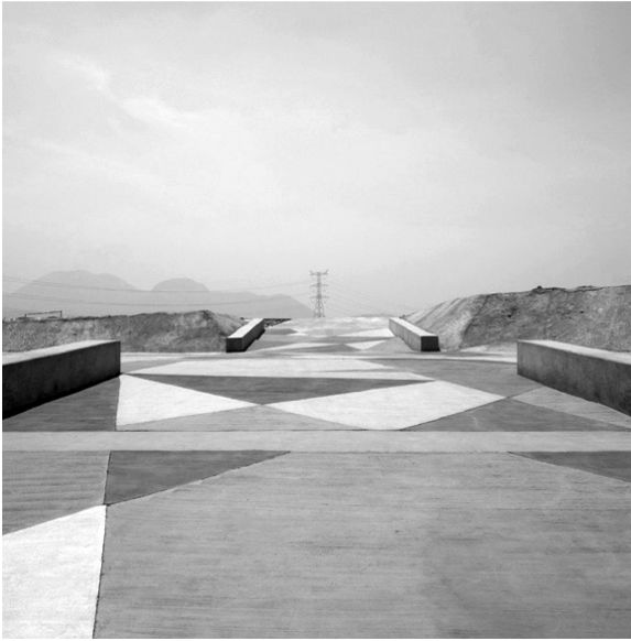
6. Detalle: Parque Deportivo Cuitláhuac (Eje 6 sur) .

gastada, restos de basura y una perspectiva dominada por las torres con sus cables colgantes que abastecen de energía a la ciudad. A unas cuadras de allí el geometrismo abstracto de los pasillos y andadores del Parque Deportivo Cuitláhuac (Eje 6 sur) (imagen 6) esconden lo que por muchos años esta área recreativa fuera un antiguo tiradero de basura, al oriente de la ciudad 21 .