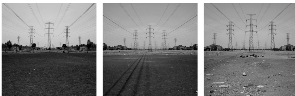
5. Detalle: Tianguis Luis Méndez (Eje 6 sur) .

gos pasillos con pretensiones modernizadoras. En el camellón de Avenida de las Torres (Eje 6 sur) (imagen 4) que cruza Iztapalapa –una de las colonias auto-urbanizadas más grandes del mundo, con 2 millones de habitantes– el parque abandonado, con sus juegos, sirve como tendedero de ropa improvisado, o para montar carpas informales, lo que sugiere un uso distinto al meramente recreativo. Más adelante, sobre el camellón de la misma avenida se instala el llamado Tianguis Luis Méndez (Eje 6 sur) (imagen 5) –también conocido como el “tianguis de la Torres”– uno de los más grandes de la megalópolis mexicana, ya que conglo-mera cientos de puestos de comerciantes ambulantes, donde se puede encontrar “fayuca” 19 , mercancía pirata 20 y todo tipo de objetos reciclados de los basureros de la capital. Bodmer muestra el paisaje despejado del camellón después del apabullante dinamismo del mercado: lo que queda es el silencio de la grava des-