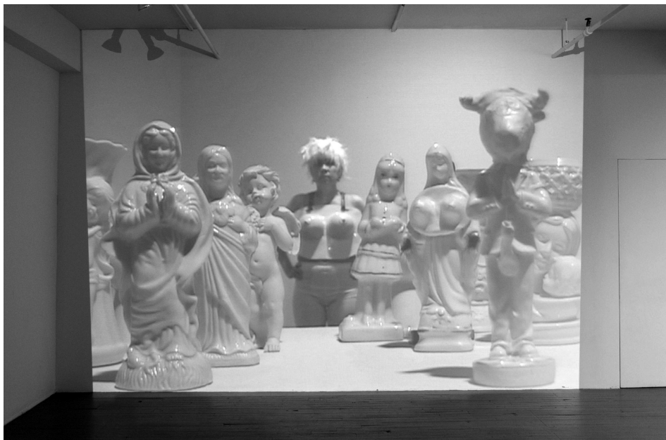
2. Cybertransfiguration de Corazón Desfasado: des performances “hors-jeu”. Performance presentado en el Centre de arts actuels Skol , en el marco de la BIAN, Biennale internationale d'art numérique (Montreal, 20 y 21 de mayo de 2016).

se autoriza y da acceso a que el «público solicitante de favores y milagros» se apropie de la expresión de su deseo haciendo decible lo indecible, en la medida en que es quien debe elegir una oración que lo interpele, como bien se puede ver en la columna derecha de la imagen. En este sentido, las sucesivas oraciones a las que puede apelar quien demanda favores muestran un flujo de emociones que se objetivizan en tres órdenes: 1. oraciones, 2. jaculatorias, 3. altares. Fuertemente ligados a la cultura mediática y de consumo, estos órdenes son espacios privilegiados para la expresión de emociones, materializadas en objetos culturales, al tiempo que manifiestan “eso” a lo que se aspira y no se posee. Exteriorización que devela un tipo de lógica afectiva, asentada entre los extremos que van desde lo que se entiende por éxito hasta lo considerado fracaso en lo personal y colectivo. Así, en palabras de Diedra Reber: «el bienestar y el malestar, expresiones de una condición somática densamente influidas por la emoción. En la época del capitalismo de libre mercado rampante, esta dicotomía vertebral se hace el nuevo lenguaje tanto del conocimiento social como de su crítica» (“La afectividad”: 97).