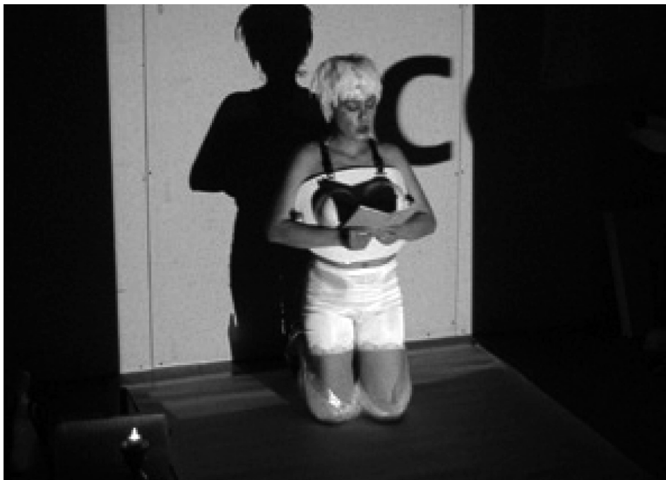
3. Prayer: I confess, according Corazon Desfasado.

da de la artista sufre un desajuste, mediante un proceso de aceleración e incluso de infantilización de la voz femenina, alterada expresamente por alguna aplicación de sonido. Mecanismo que acentúa la desacralización de la acción, al poner el acento en el guiño irónico que produce la alteración sonora, conservando siempre el acento de la artista; es decir, la cadencia del español colombiano cuando se expresa en su lengua materna, o del español cuando lo hace en inglés o francés. La preservación del acento hispano al hablar en otras lenguas se suma al contenido de la propuesta de la artista, quien asume que «hace parte de mi realidad y de la realidad de muchos que deben expresarse en lenguas que no son las maternas. Y esto es asumir la dificultad que esto implica» 13 . Por otra parte, resulta igualmente significativo evidenciar el proceso de construcción de las oraciones o jaculatorias. Se trata de visibilizar un producto multilingüe, un artefacto manipulable, tanto desde el punto de vista de la artis-