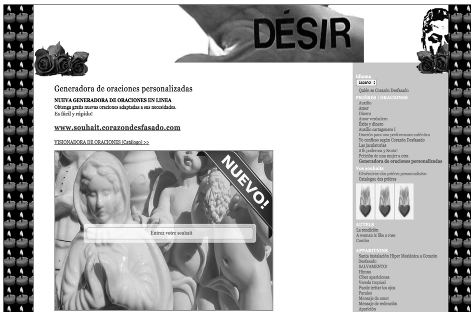
4. Captura de pantalla de Generadora de oraciones personalizadas .

ta que selecciona una serie de frases y se combinan aleatoriamente 14 , como desde el punto de vista de quien “escribe sus deseos”, transformándose en partícipe activo de la acción, en un nuevo “ciber devoto-solicitante”. Este es el propósito último de Generadora de oraciones personalizadas , una nueva forma de aparición de Corazón Desfasado en el ciberespacio.