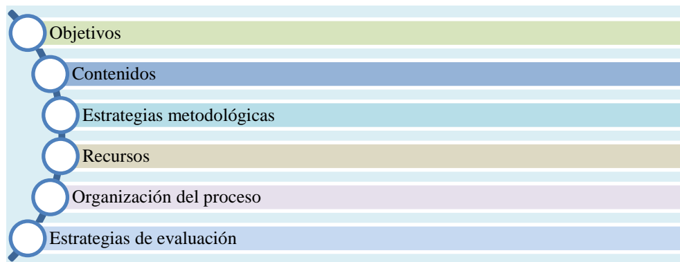
Figura 4. Componentes de una guía didáctica

Según lo expuesto por el autor, se afirma que una guía didáctica es una herramienta integrada por componentes puntuales y esenciales. El diseño de esta guía permitirá estructurar un recurso de apoyo docente para el desarrollo de la inteligencia lingüística y el nivel de lectura en los estudiantes de la básica superior (octavo, noveno y décimo año de educación general básica). Los educadores contarán con pautas que los motiven a aplicar acciones formativas de manera organizada y ordena. Mediante la Figura 1, se pueden observar los componentes de una guía didáctica.