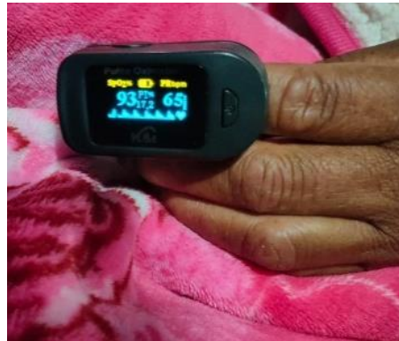
Figura 4: Valores de saturación de oxígeno y FC al usar CPAP

paciente y familiares se negaron al uso de ventilación asistida, por lo que bajo su consentimiento se decide el uso de CPAP en domicilio.