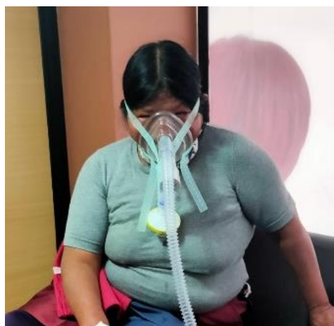
Figura 5: Colocación de CPAP en paciente

En la Figura 4, observamos los valores de FC y de saturación de oxígeno tras colocar el dispositivo. La mejoría es inminente con el uso de CPAP. Se brindó además un esquema antibiótico, antiinflamatorios, insulina para control de diabetes, entre otros medicamentos. Esto permitió que después de 5 días de uso continuo, se pueda retirar el dispositivo CPAP y se maneje con mascarilla para reservorio, mascarilla simple, cánula nasal y al final se retiró totalmente el oxígeno para permitir sesiones de fisioterapia respiratoria y mejoría total de nuestra paciente.