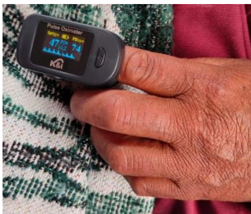
Figura 3: Saturación de oxígeno y FC inicial al ingreso del paciente

Se presenta el caso de una paciente femenina proveniente de una comunidad rural ubicada al noreste de la provincia de Tungurahua. Como antecedentes laborales, la paciente se dedica al cuidado de animales de granja como cuyes, conejos, ordeño de vacas. Como antecedentes patológicos de importancia, es una paciente con IMC de 35 catalogada como obesidad grado II. Además, la paciente presentó diabetes mellitus sin tratamiento alguno y no reporta otro tipo de antecedentes personales ni familiares. La paciente acudió a consulta médica refiriendo falta de aire, fiebre y decaimiento de 5 días de evolución.