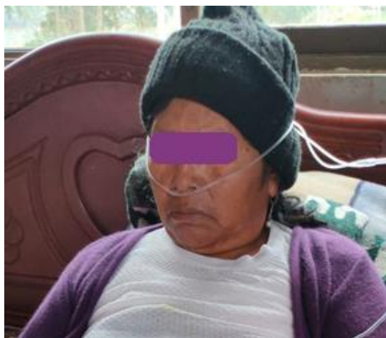
Figura 6: Paciente con cánula nasal posterior a uso de CPAP