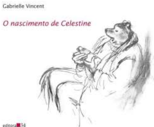
Figura 4: Capa do livro O nascimento de Celestine (2014)

todas em tons de sépia” (CROIX, 2014, p. 173). A autora relata que precisava de muitas páginas para contar a história que seria o começo dos seus então célebres personagens, e também de uma nova forma de expressão.