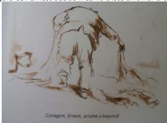
Figura 15: Ernest decide mesmo triste arrumar a casa

Fonte: arquivo pessoal da pesquisadora, ilustração presente no livro O nascimento de Celestine (2014, p. 137)