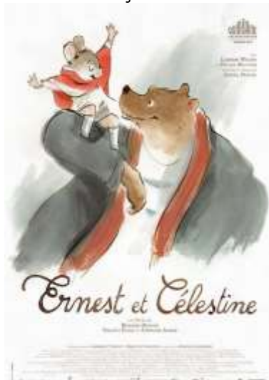
Figura 5: Cartaz da animação Ernest e Celestine (2012)