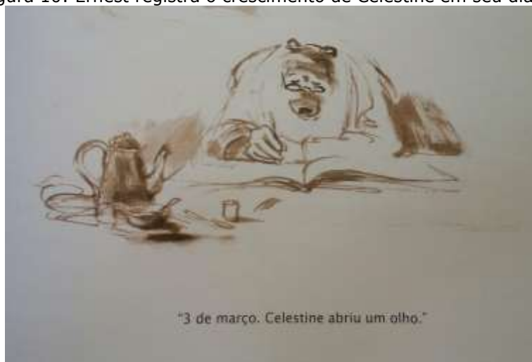
Figura 10: Ernest registra o crescimento de Celestine em seu diário.