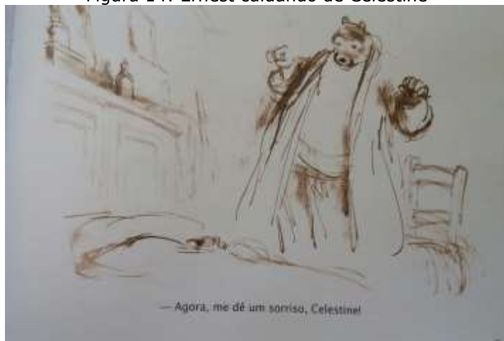
Figura 14: Ernest cuidando de Celestine

Fonte: arquivo pessoal da pesquisadora, ilustração presente no livro O nascimento de Celestine (2014, p. 45).