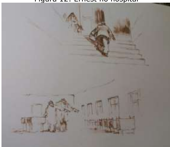
Figura 12: Ernest no hospital

Fonte: arquivo pessoal da pesquisadora, ilustração presente no livro O nascimento de Celestine (2014, p. 147).