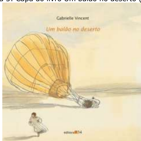
Figura 3: Capa do livro Um balão no deserto (2014)