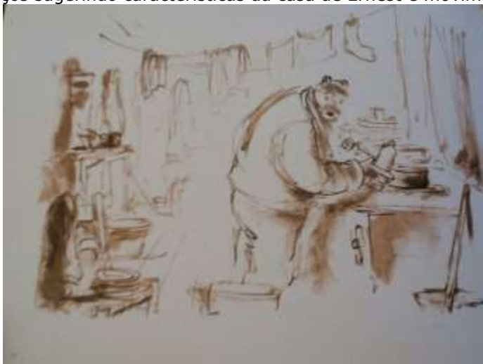
Figura 13: Traços sugerindo características da casa de Ernest e movimento do esboço