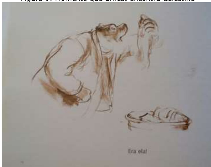
Figura 9: Momento que Ernest encontra Celestine

Fonte: arquivo pessoal da pesquisadora, ilustração presente no livro O nascimento de Celestine (2014, p. 20).