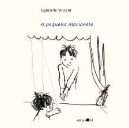
Figura 1: Capa do livro A pequena Marionete (2007)