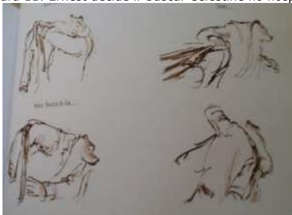
Figura 11: Ernest decide ir buscar Celestine no hospital

Fonte: arquivo pessoal da pesquisadora, ilustração presente no livro O nascimento de Celestine (2014, p. 145).