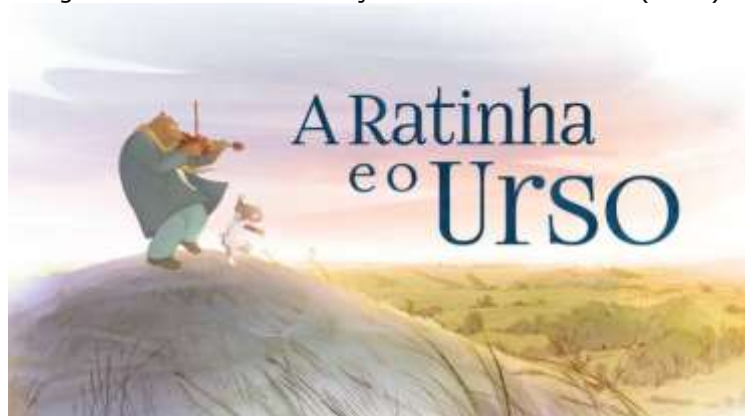
Figura 6: Cartaz da animação A Ratinha e o Urso (2017)

Os personagens também se transformaram em uma série animada, tendo estreado em 1 de abril de 2017. A série é exibida no Brasil com o nome "A Ratinha e o Urso" pelo canal TV Brasil.