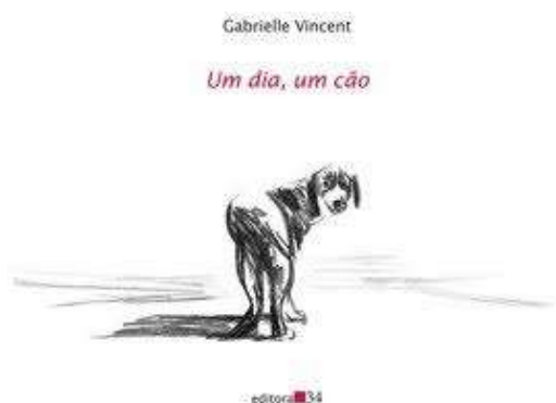
Figura 2: Capa do livro Um dia, um cão (2013)