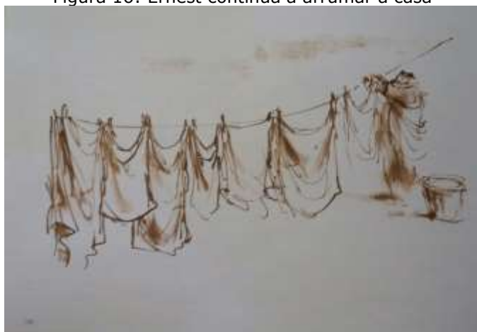
Figura 16: Ernest continua a arrumar a casa

Fonte: arquivo pessoal da pesquisadora, ilustração presente no livro O nascimento de Celestine (2014, p. 138).