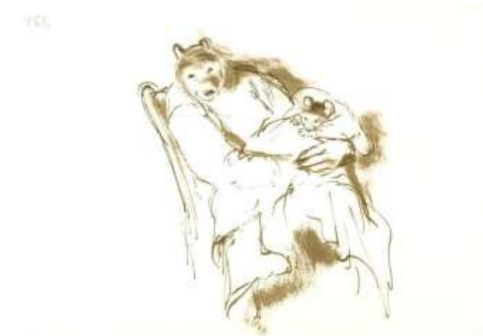
Figura 17: Final do livro Ernest e Celestine e começo para outros livros

Fonte: arquivo pessoal da pesquisadora, ilustração presente no livro O nascimento de Celestine (2014, p. 165).