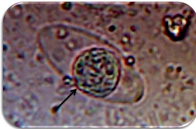
Figura 2. Cystoisospora belli , Ooquiste con un Esporoblasto. Objetivo de 40X. Solución Salina.