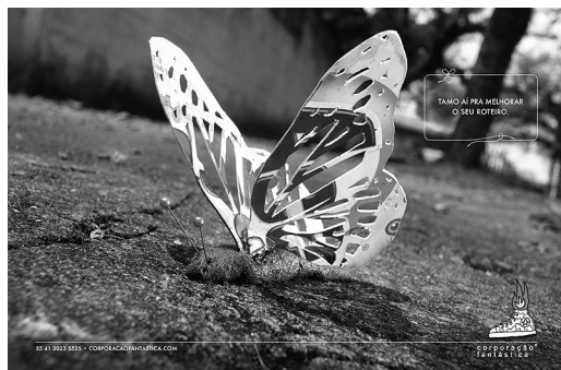
Figura 1 – Cocôs – Borboleta. Corporação Fantástica. Agência: Santa Clara Nitro. Brasil. 10 nov. 2009.

A produtora que assina o anúncio, Corporação Fantástica, mostra, assim, por meio de uma rede semântica englobando seu texto verbal e visual, que ela tem o poder, fantástico , de transformar alquimicamente, com seu toque de Midas, o chumbo em ouro – a ideia vulgar de uma dupla de Criação em um belo filme