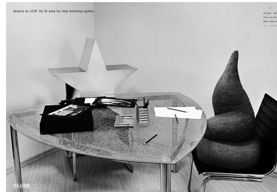
Figura 5 – Anuário do CCSP. Há 30 anos faz toda diferença ganhar – 1. Clube de Criação de São Paulo. Agência F/Nazca S&S.

Sim, por meio desses exemplos, podemos dizer que a angústia dos criadores foi incorporada ao estoque de recursos persuasivos do qual eles lançam mão para fazer suas peças publicitárias e, assim, mercantilizada em forma de