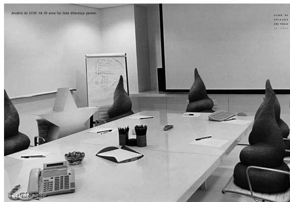
Figura 4 – Anuário do CCSP. Há 30 anos faz toda diferença ganhar – 2. Clube de Criação de São Paulo . Agência F/Nazca S&S.

A narrativa que se delineia ali, hiperbolicamente como costuma ser quando se caricaturiza uma situação, é simples, além de expressar com transparência a luta pelo poder no campo publicitário; e a podemos sintetizar da seguinte maneira: o profissional premiado por esse clube é uma estrela, goza de prestígio e se destaca numa equipe de Criação, enquanto os que não ganham o prêmio são, ipsis litteris , uns bostas . Tal proposta criativa, levada a cabo discursivamente pela escolha do escatológico, tanto